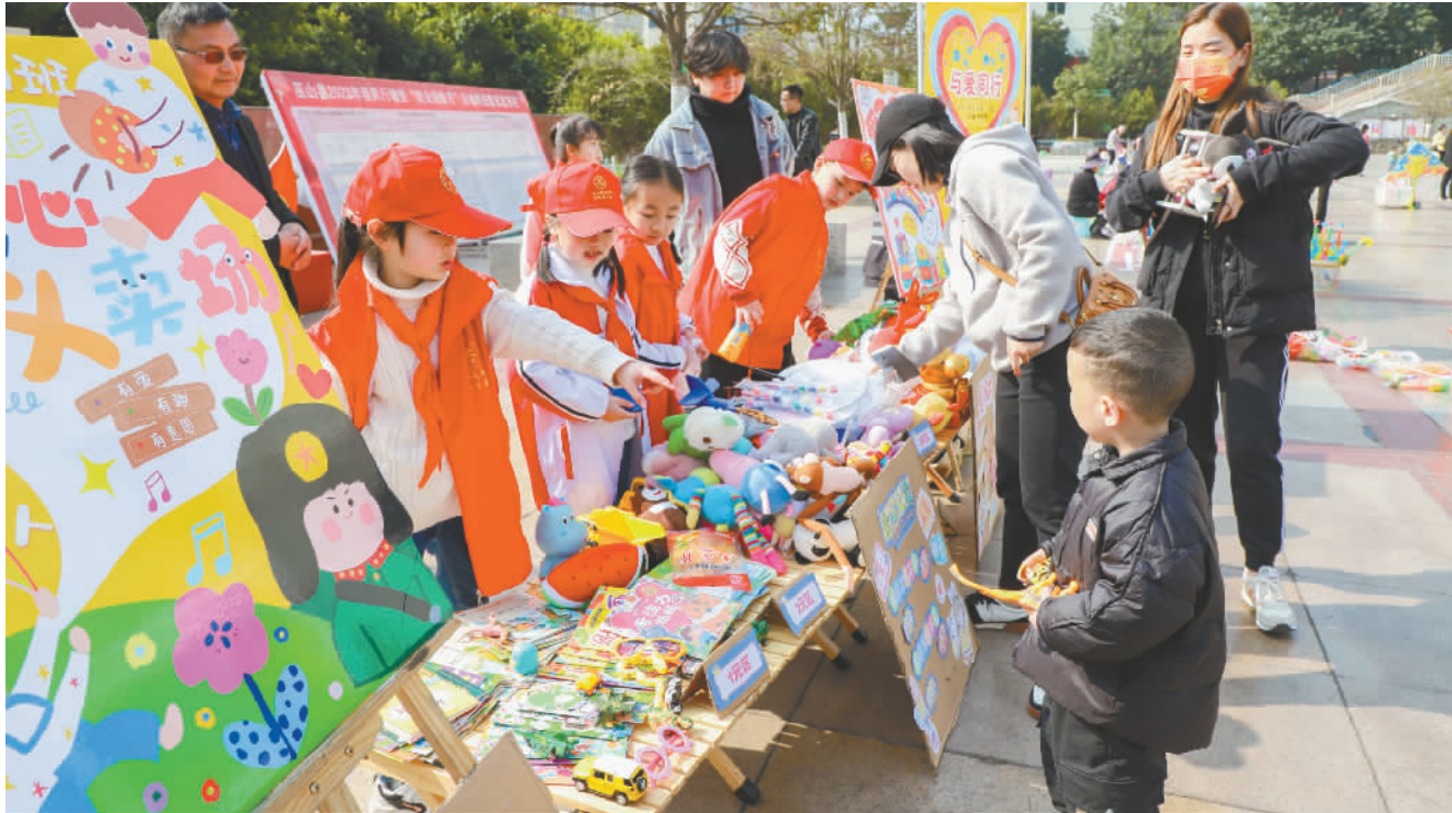
小学生们在广场开展义卖活动,培养学生从小树立乐于助人、奉献爱心的良好品质。

此次活动不仅净化了社区环境,增强了大家的服务、奉献意识,还带动了社区居民养成自觉保持环境卫生的习惯,提高了辖区居民的幸福指数和生活质量。