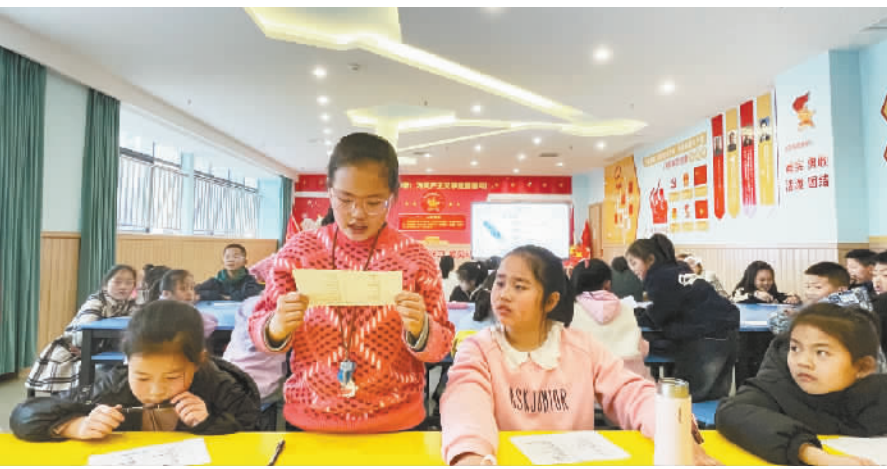
互动环节,孩子们大声读自己的心声。

本报讯 (记者 向君玲 文/图) 3月17日,团县委、县妇联、县青少年宫与巫山心康心理服务机构,联合举办主题为“认识自我,走进自我”儿童心理健康讲座,进一步引导学生认识自我,为更好地成长发展奠定基础。