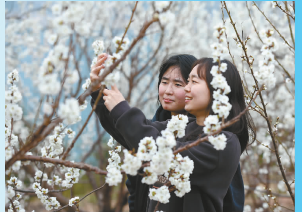
大溪乡,樱花绽放,吸引游客来。