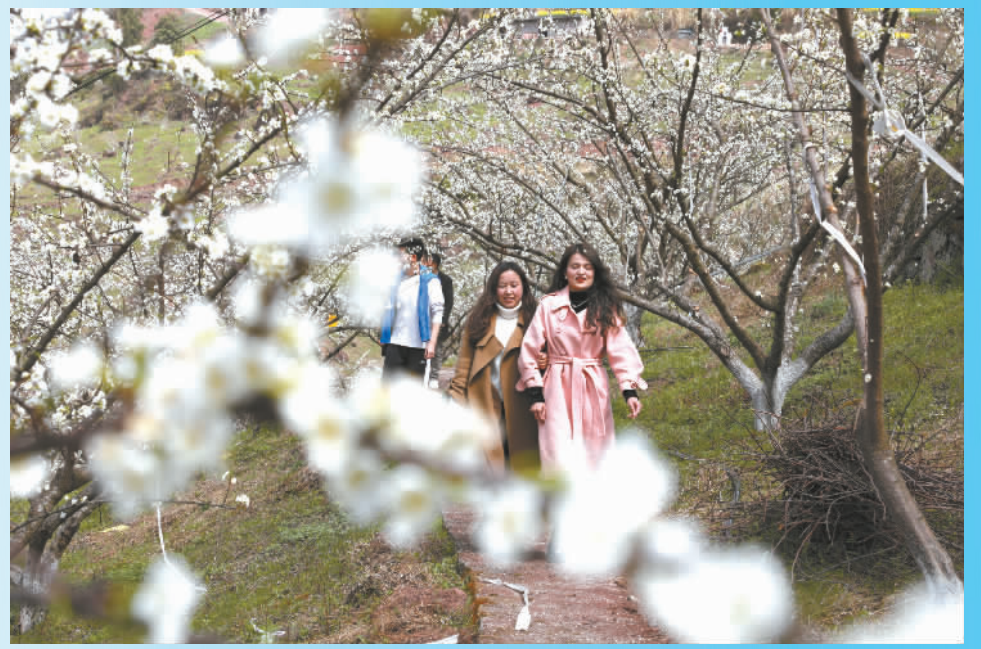
龙溪镇,李花渐次开放,客在花间漫步。