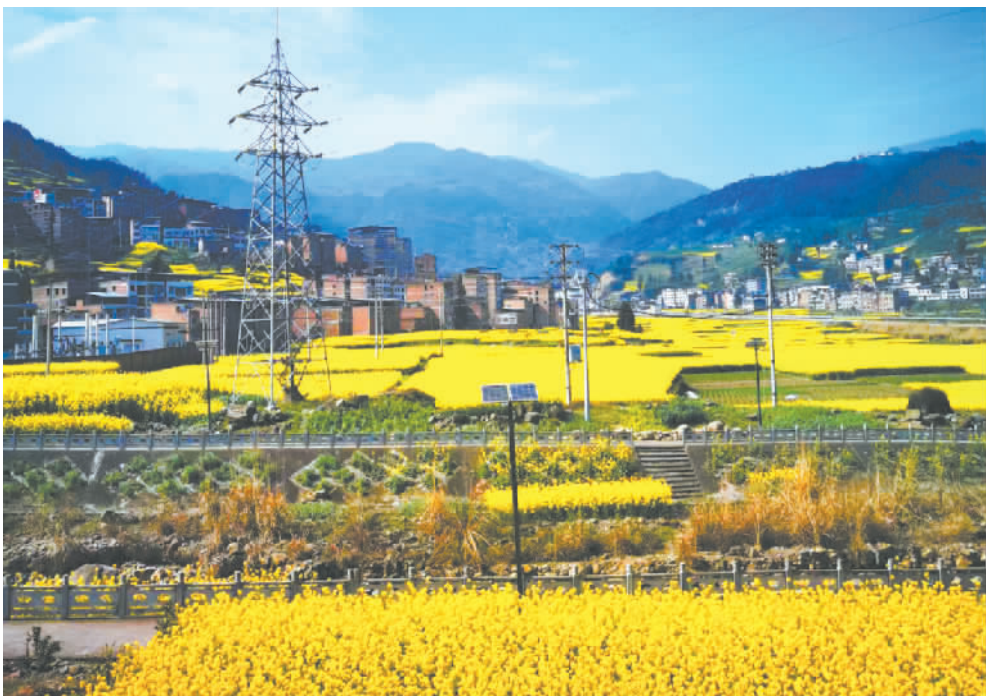
福田镇油菜花开了。