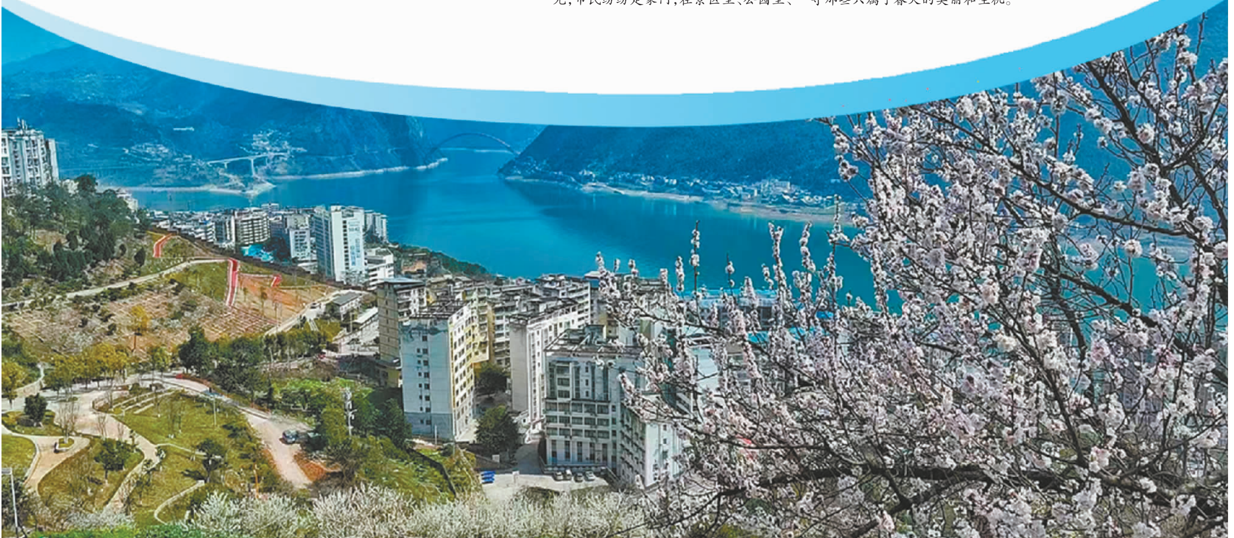
春花绕城。

街道上晒着太阳、赏着美景、闻着花香,感受浓浓春意,共同追寻春天的气息,探寻那些只属于春天的美丽和生机。