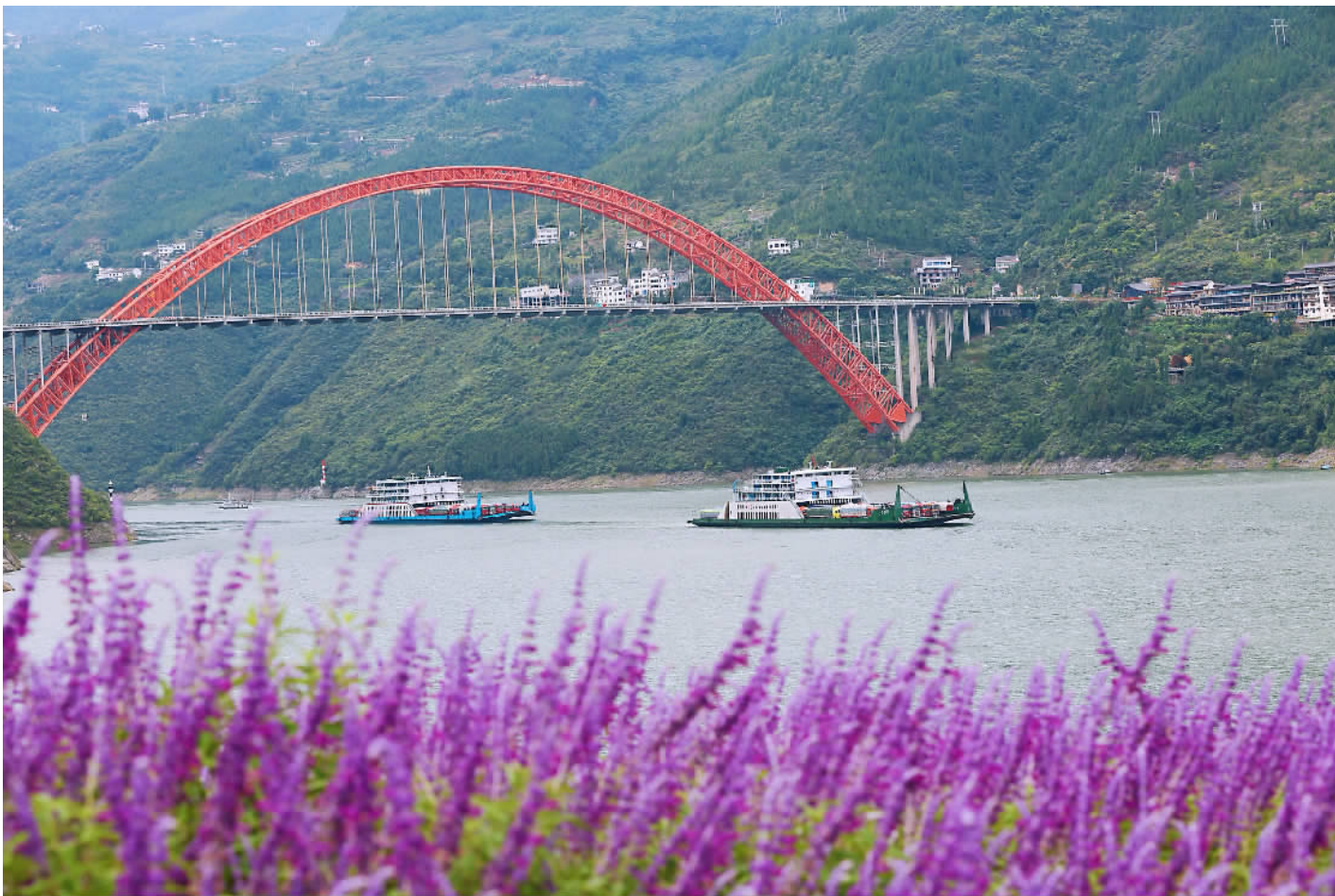
春日宁江渡。