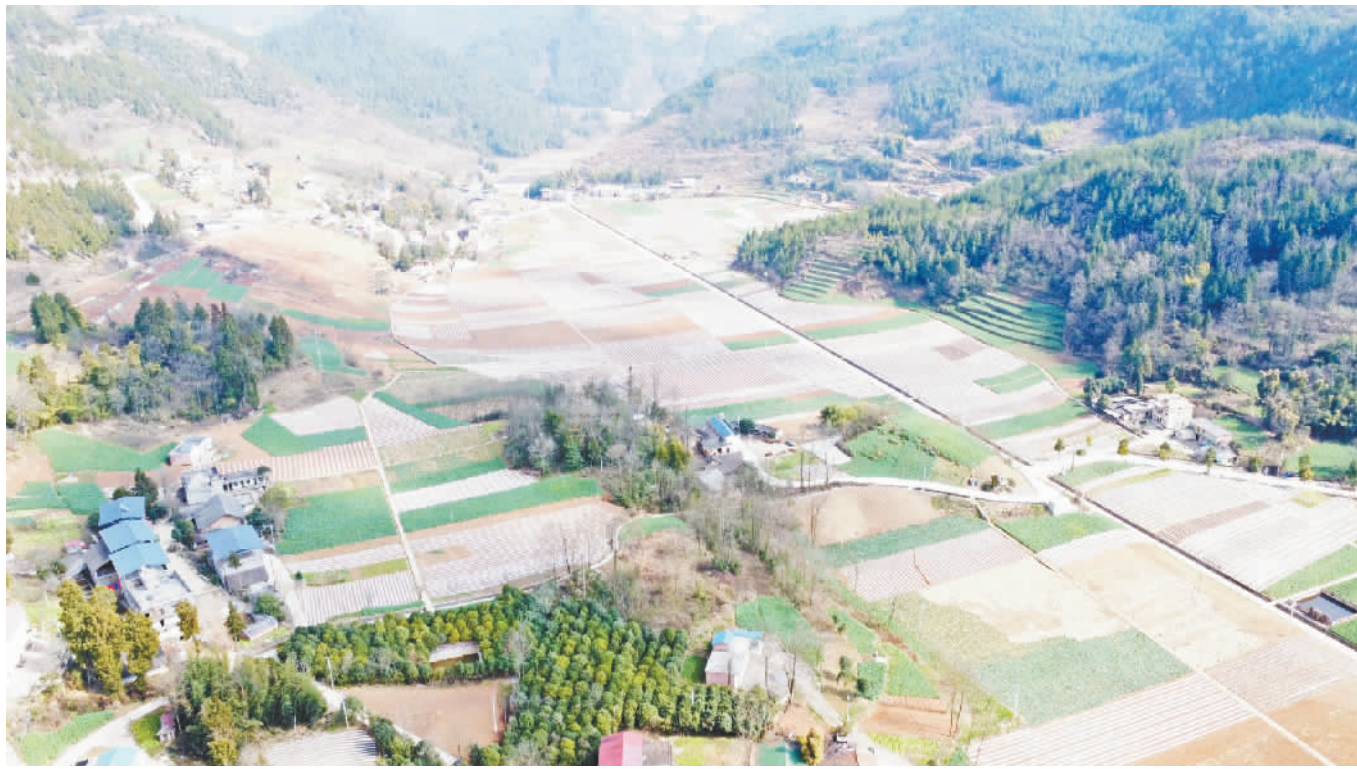
已经完成的高标准农田。

本报讯（记者 雷行星 文/图）一年之计在于春，眼下正是春耕备耕的大好时节。在铜鼓镇，高标准农田建设正如