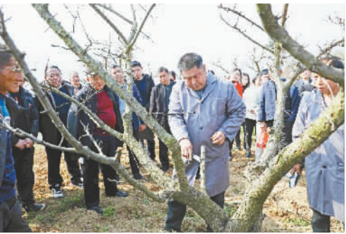
果业中心技术人员在曲尺乡权发村脆李园中指导果农对脆李树进行春季管护。

巫山脆李现已确定为我县“1+3+2”现代特色高效农业产业之一。挂果面积达14万亩，年总产量13.5万吨，综合产值已突破18亿元。