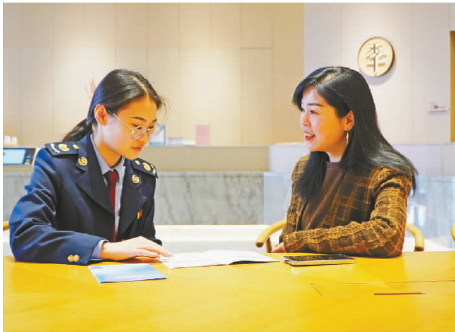
税务工作人员上门为餐饮企业的法人讲解相关政策。