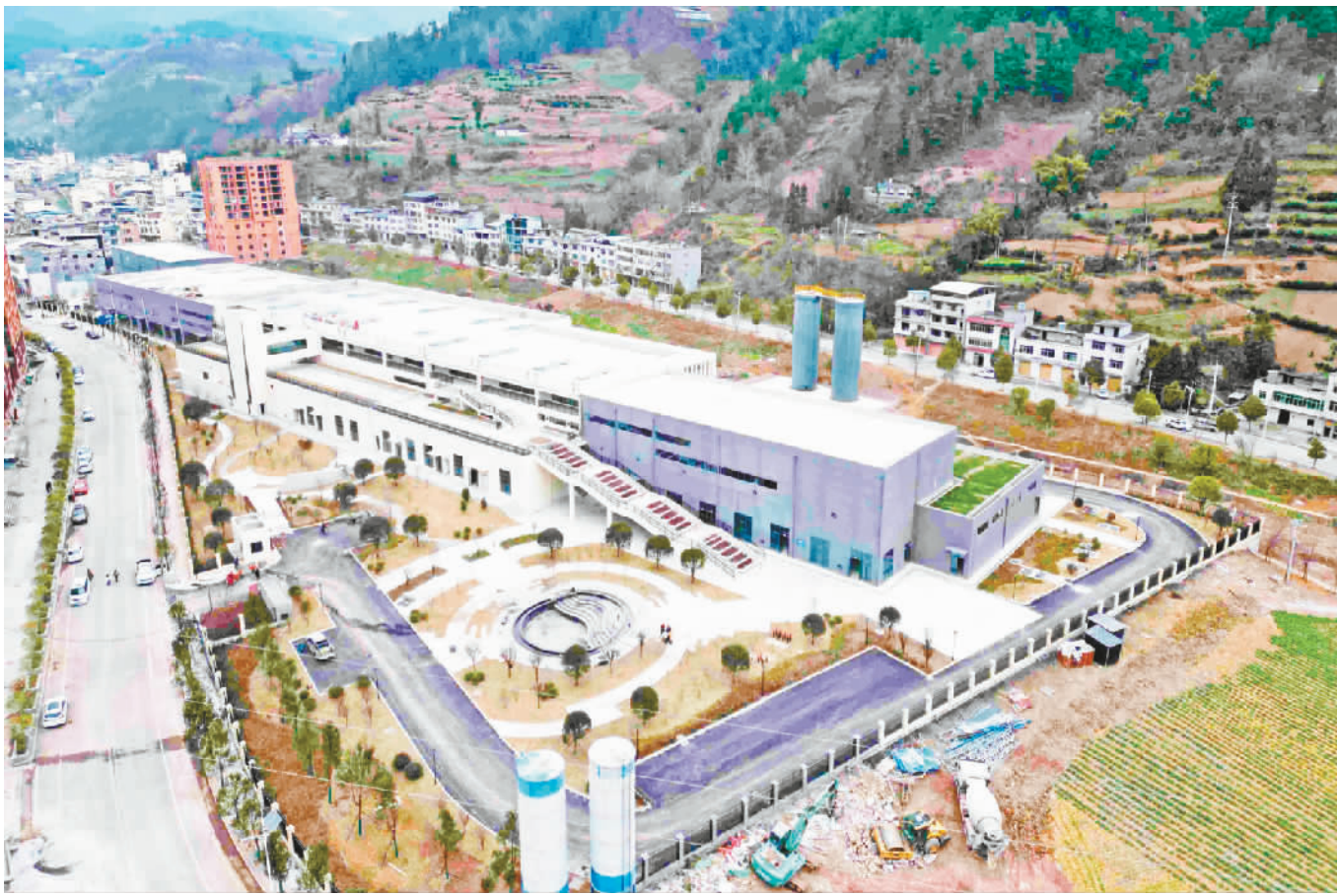
即将投用的巫山脆李特色产业园。

本报讯 (记者 董存春 王忠虎文/图) 1月31日,记者在巫山脆李特色产业园项目建设现场看到,产业园雏形已现,几十名工人正在安装生产车间设备、打造室外景观绿化等。