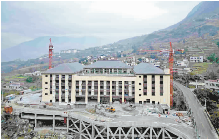
巫山第一失能特困集中供养项目一隅。

本报讯 (记者 鲁作炳 王忠虎周子杰文/图) 1月31日,记者在巫山第一失能特困集中供养项目建设现场看到,工人们正在忙碌,抓紧完善相关设备设施。