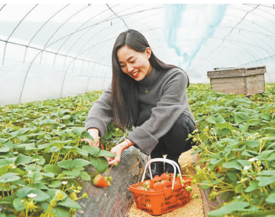
游客正在采摘草莓。

本报讯 (记者 陈久玲 实习生 邓厚双文/图) 1月29日,走进双龙镇白坪村的草莓采摘大棚内,扑面而来的是一股浓郁的果香,一颗颗红彤彤的草莓在绿叶的映衬下,泛出诱人的光泽,绿叶红果十分“养眼”。游客们手提果篮,穿梭于垄沟之间,忙着采摘、拍照,绘出一片“莓”香满满的暖冬图景。