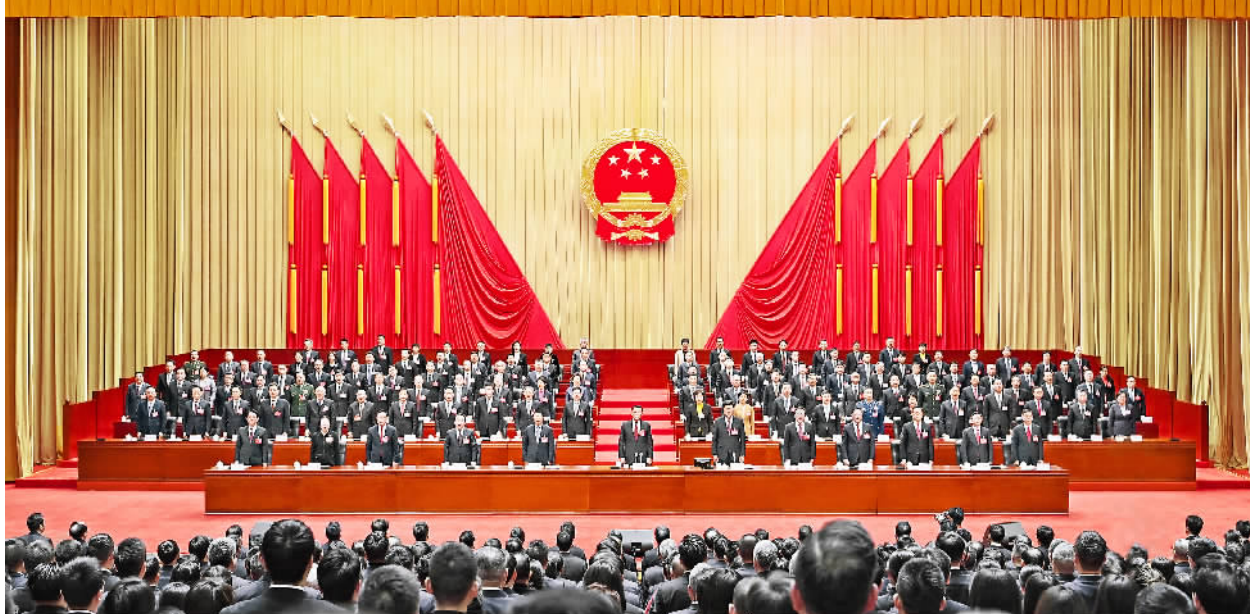
1月24日下午,在市人民大厦,重庆市第六届人民代表大会第二次会议在庄严的国歌声中闭幕。