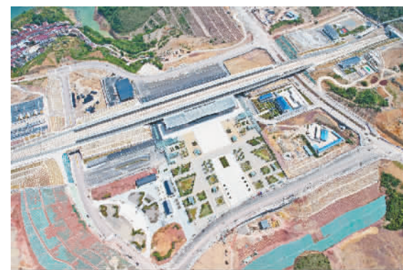
方便快捷的桂花大道。

本报讯(记者 郝燕来 文/图)12月14日,记者在桂花北路、高铁下穿道、迎宾大道、梨园路等路线看到,目前这些道路均已通车,路面平坦干净,各种车辆穿梭来往。这些道路与巫山东出口、楚阳大道、龙江隧道、早阳大道(原桂花大道)等主干路的贯通,让当地的居民生活出行更加便利,让早阳组团、龙江新区与外界联系更加紧密。