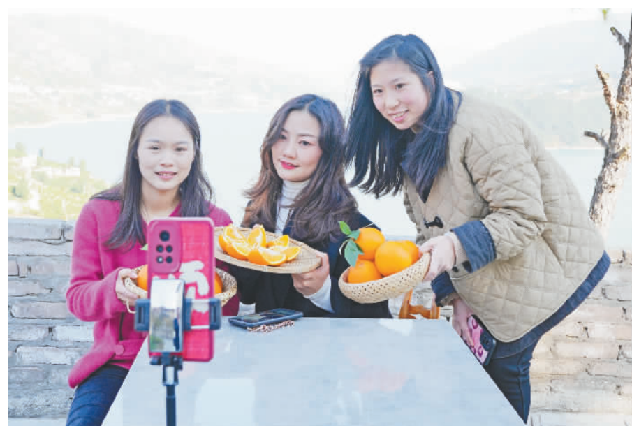
工作人员通过直播平台销售柑橘。