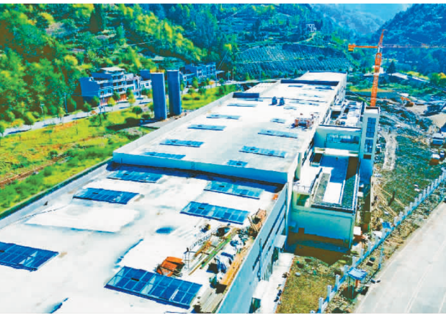
初具雏形的巫山脆李特色产业园。

巫山脆李特色产业园是推动巫山脆李产业发展的民生工程，项目的实施加强了脆李采摘后商品化处理，利用相关技术对果果进行深加工，延长其产业链，提高商品供给率，同时运用互联网、物联网技术，延长产业链条、促进产业融合，推动脆李产业结构调整、保障产业健康、可持续发展。