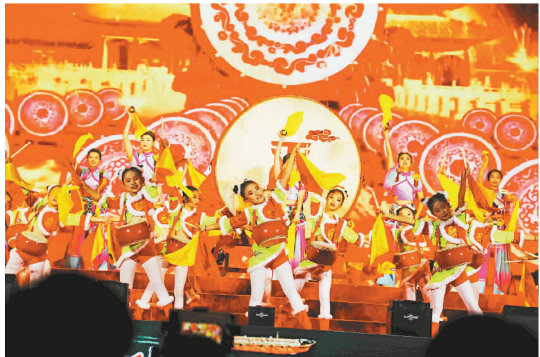
开场鼓舞《鼓乐敲出幸福路》。