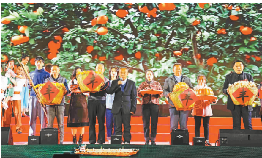
情景表演《好一个巫山下庄村》。