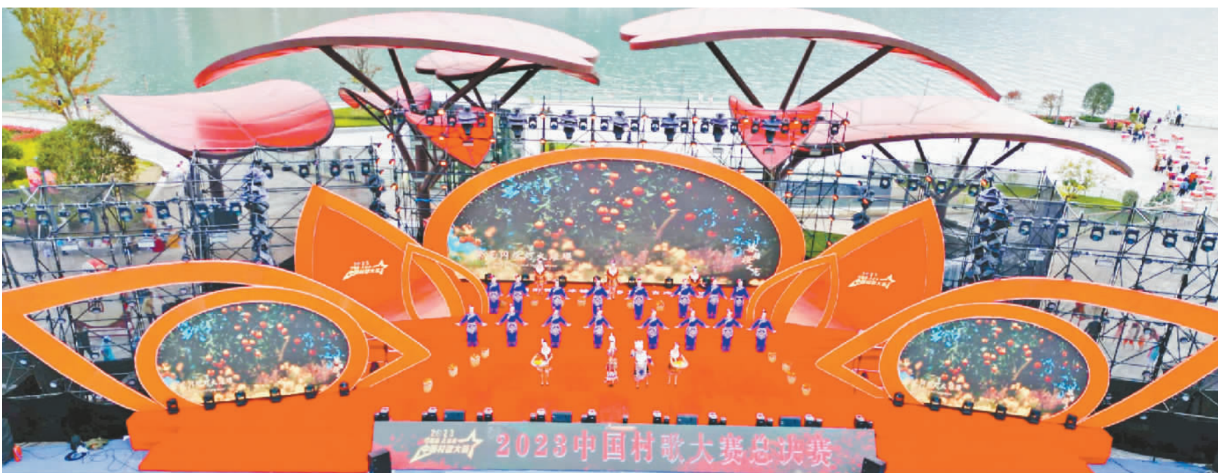
2023 中国村歌大赛总决赛现场。

本报讯 11月18日,巫山县红叶广场上歌声嘹亮,2023中国村歌大赛总决赛在此举行。经过激烈比拼,我市忠县磨子乡竹山村歌《竹山之歌》、长寿区云集镇青丰村歌《青丰颂》分别获得三等奖,《好一个巫山下庄村》获得特别贡献奖。