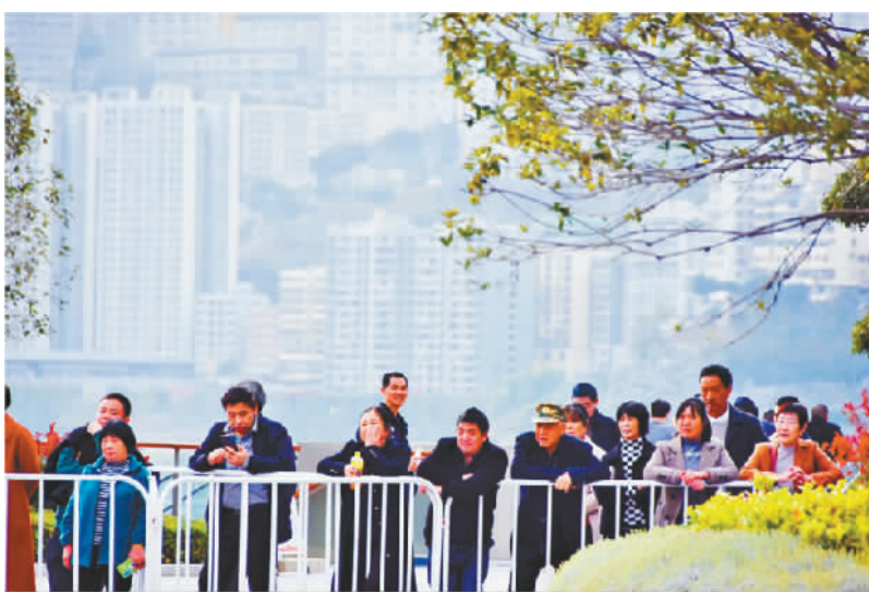
市民关注赛事。