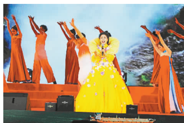
歌舞《江山红叶》。王忠虎 摄