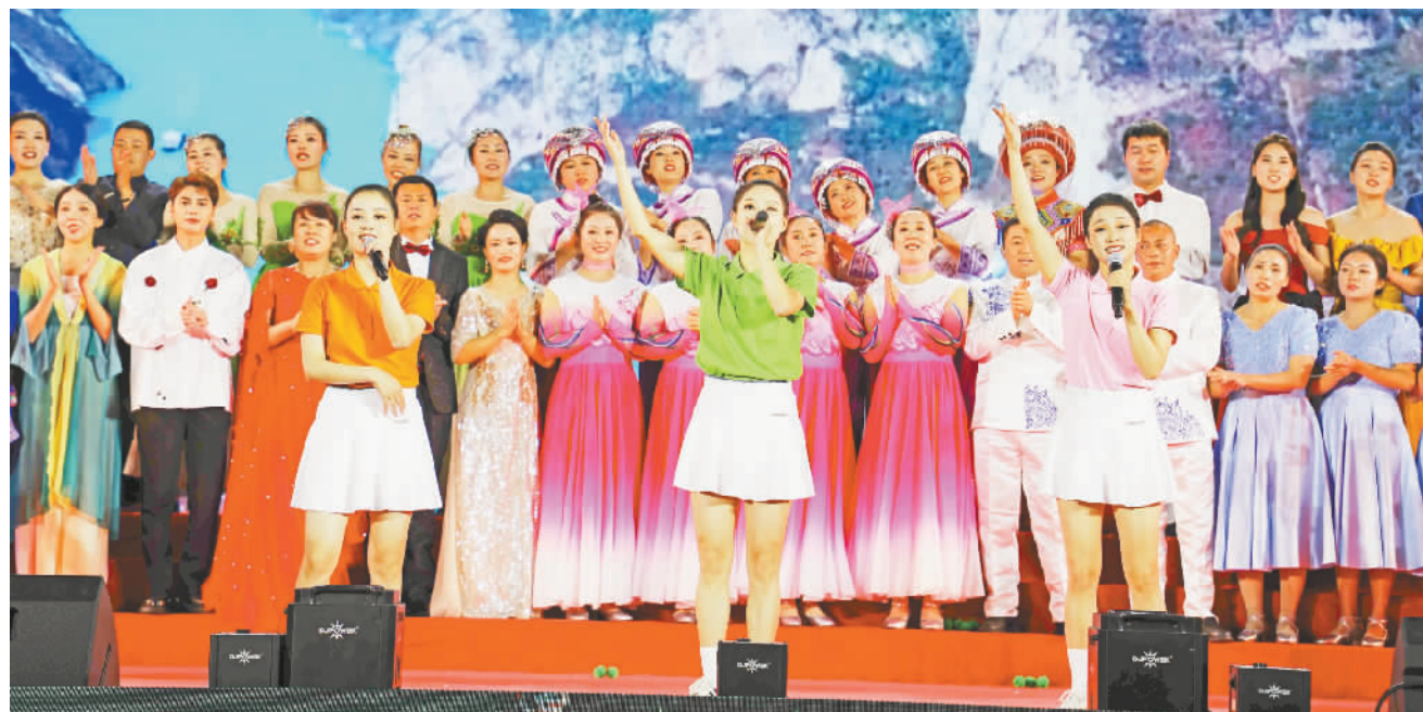
大合唱《满山红叶似彩霞》。