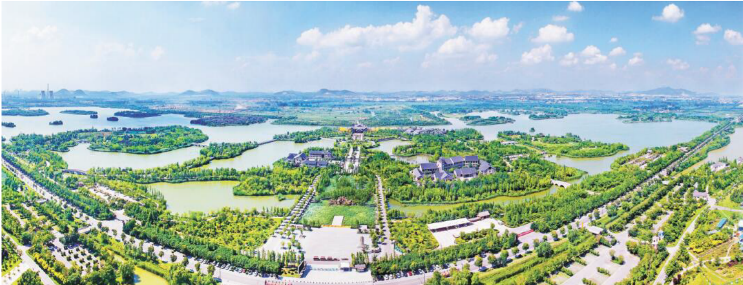
潘安湖这个昔日最大的采煤塌陷地,如今已是“湖润茶美、游人如织”的生态公园。

从大刀阔斧的生态修复到方寸之美的精心构建,近年来,徐州的绿色一直在不停地延伸、扩展,成就了“一城青山半城湖”的美誉。国家环保模范城市、国家生态园林城市、国家森林城市、联合国人居奖……各种荣誉接踵而至。