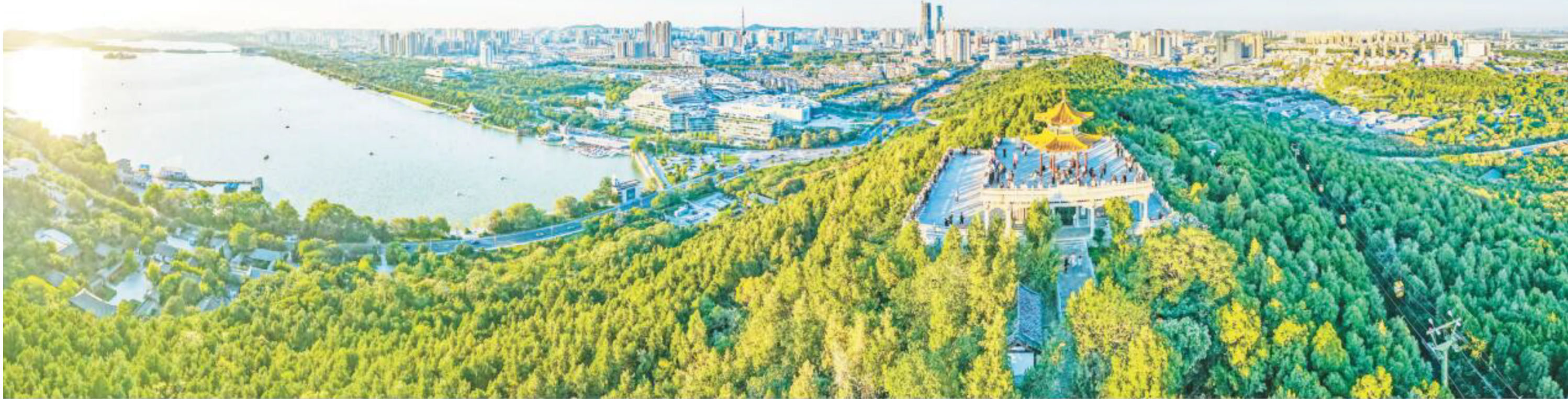
连日来,不少市民登上云龙山远眺,秀美的城市风光尽收眼底,“一城青山半城湖”的美景令人心旷神怡。

本报讯 10月25日至27日,2023中国报业媒体技术创新发展大会暨“百家媒体看徐州”采风活动在徐州举行。期间,来自国家级、省级、地市级和县级媒体的近200名代表相聚徐州,在共话传媒行业技术创新之际,沉浸式感受徐州的人文魅力和城市风采。