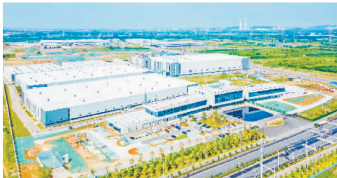
金阳新能源高效异质结电池产业园。

在这座城市,有超过六成的专精特新“小巨人”企业属于重点培育战略性新兴产业领域,超七成深耕行业10年以上,超八成居全省