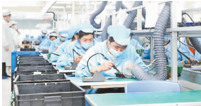
精创冷链物联网核心控制器研发生产项目年产冷链电子项目终端产品100万台。