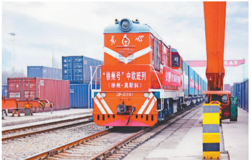
“徐州号”中欧班列。

如今的徐州,商贸辐射半径已“扩”至150公里,中心商圈外地区居民消费占比超过3成。2023年春节期间,徐州中心商圈大型商业综合体的外来消费占比达50%以上,同比提高5个百分点。