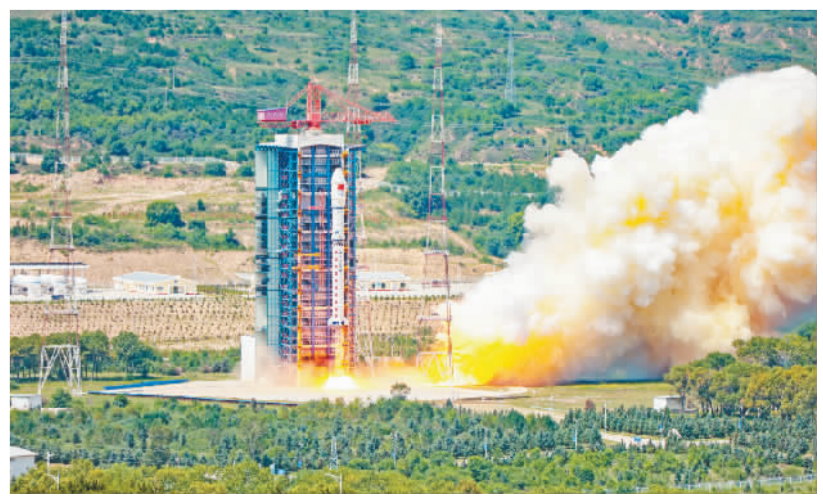
“矿大南湖号”卫星发射成功。