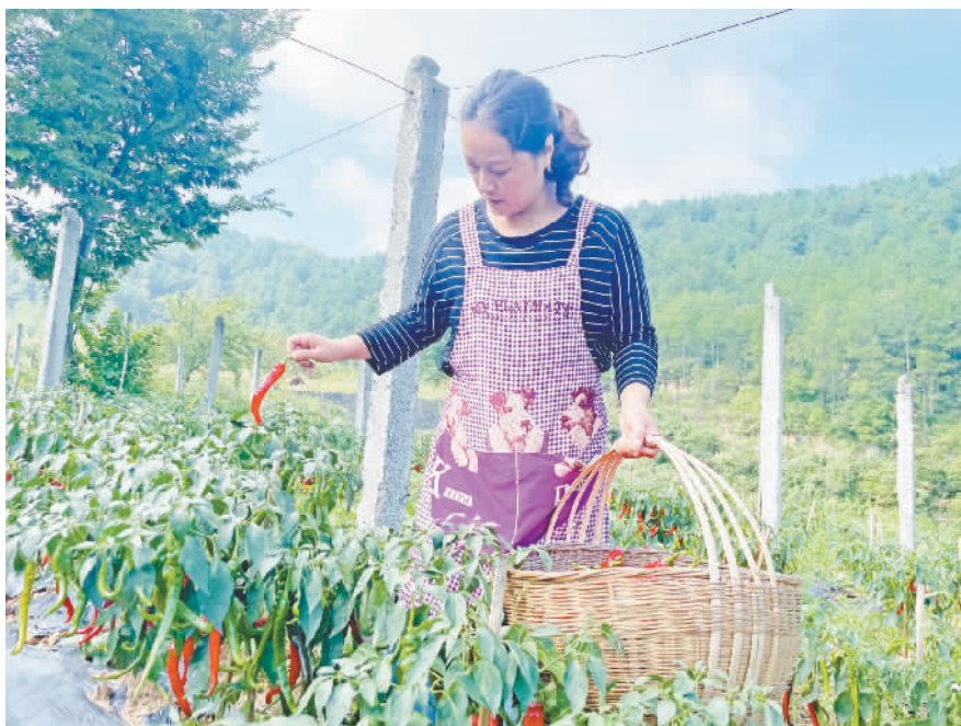
春晓村村民正在采摘辣椒。

本报讯 (记者 余雨芳 雷行星 文/图) 近日,记者在建平乡春晓村的辣椒种植基地里看到,一排排辣椒树生长旺盛,红绿交错的辣椒挂满枝头,十分喜人。种植户们穿梭其中,双手熟练地挑选、采摘红辣椒,现场一派忙碌的丰收景象。