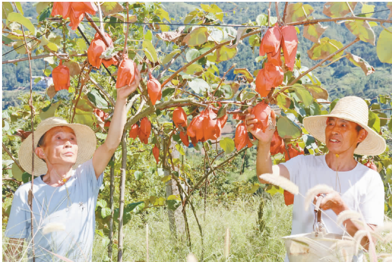
果农正在采摘猕猴桃。

本报讯 (记者 陈久玲 实习生 周子杰 文/图) 金秋时节,正是骡坪镇路口村猕猴桃丰收的季节,一颗颗猕猴桃挂满枝头,田间地头处处可见村民们忙碌的身影,洋溢着丰收的气息。