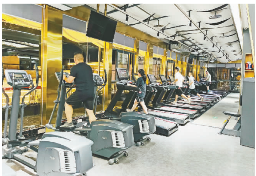
市民在健身房锻炼。

“夜经济”日益繁荣,服务场景不断拓展,夜晚的时间被“拉长”,空间也在“延展”,多元化的体验,让生活变得有滋有味,也更多姿多彩。