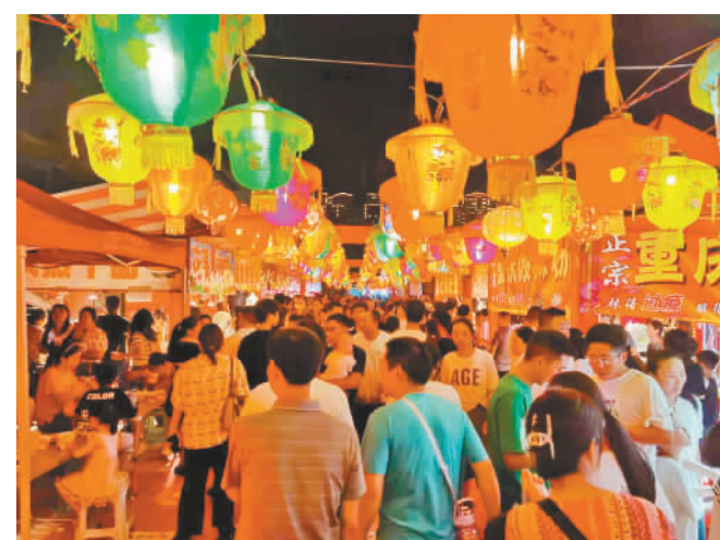
2023巫山消费助力乡村振兴农产品购物节暨非遗打铁花灯笼秘境美食集市。

县商务委负责人表示,为激发市场活力,挖掘消费潜力、促进消费持续增长,我县将持续推出特产展销、特色美食节及消费季等各类活动,引导市民线上线下消费,助力市场循环畅通。