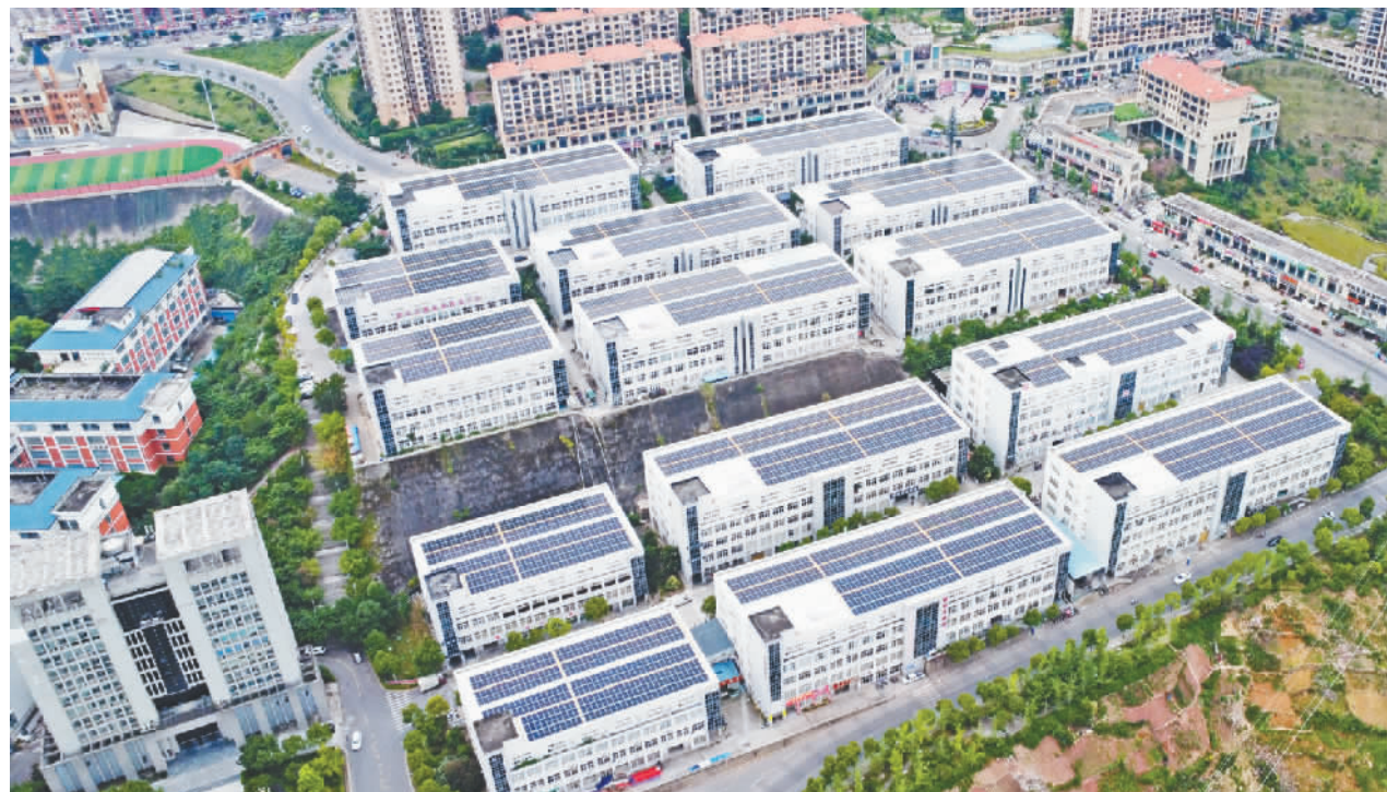
县工业园区屋顶光伏发电项目。

本报讯(记者 陈久玲 文/图) 整齐排列的太阳能光伏板在阳光下熠熠生辉,一片片光伏板源源不断地把清洁电力送往千家万户……这样的场景,如今就在县工业园区的屋顶上。