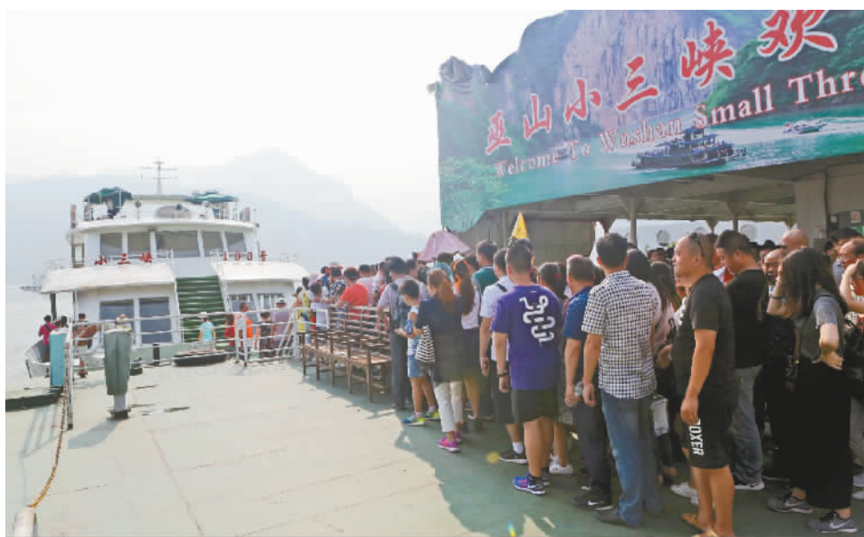
游客排队进入巫山小三峡景区游船。