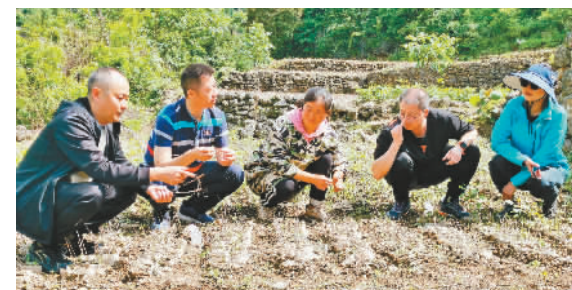
检查组在苗圃进行技术指导。

本报讯(记者 王忠虎 文/图) 近日,市森林病虫害防治检疫站检疫科负责人率队走进我县,就林木种苗质量开展检查,并指导黄桷、枫香等景观苗木的生产。