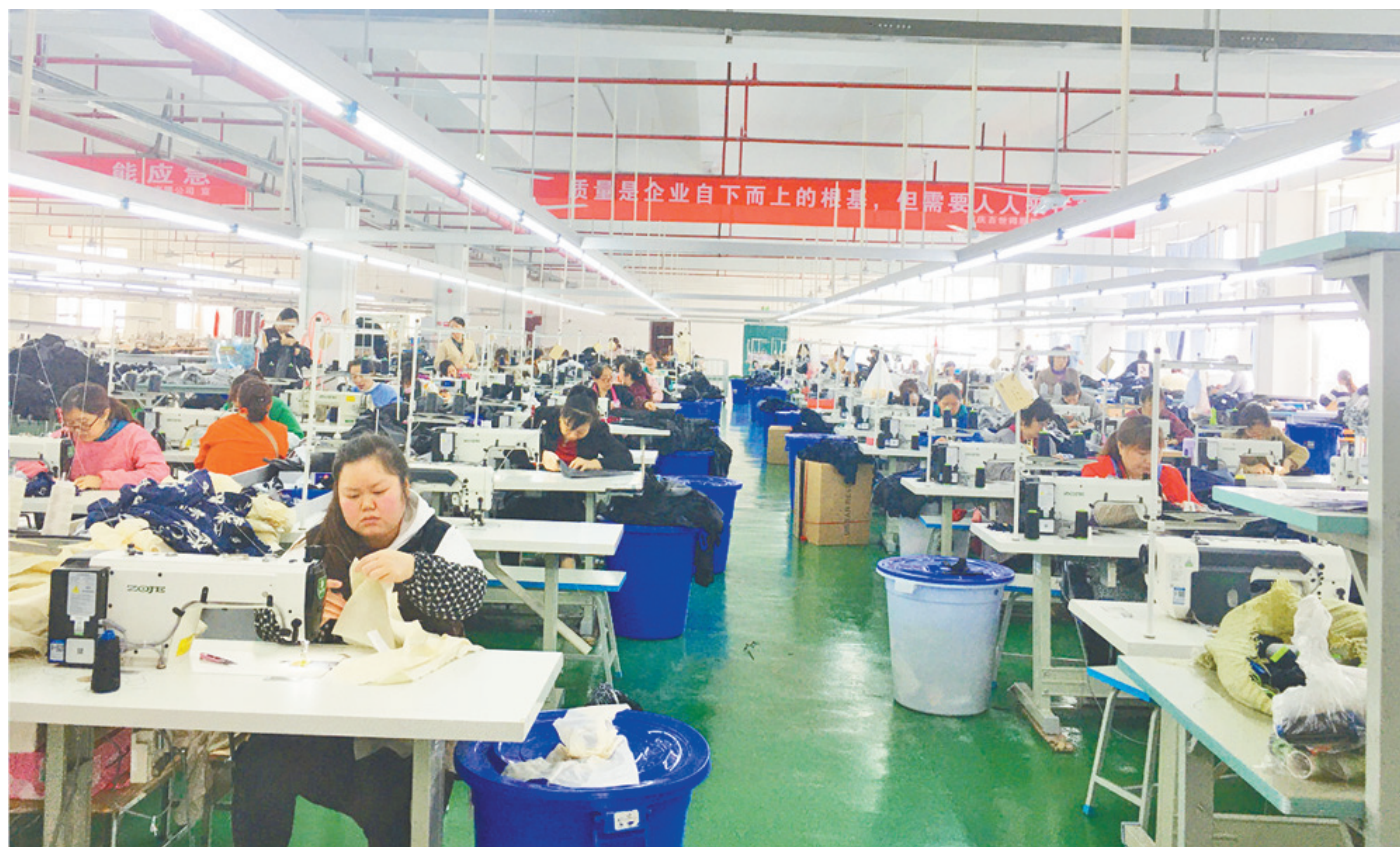
工人正在赶制订单。

本报讯(记者 董存春 陈久玲 文/图) 5月中旬,记者走进县工贸园区职教园的生产厂房,标准化的厂房设计,明亮舒适的工作环境,工人们开足马力赶制订单,所到之处,皆是忙碌的身影。