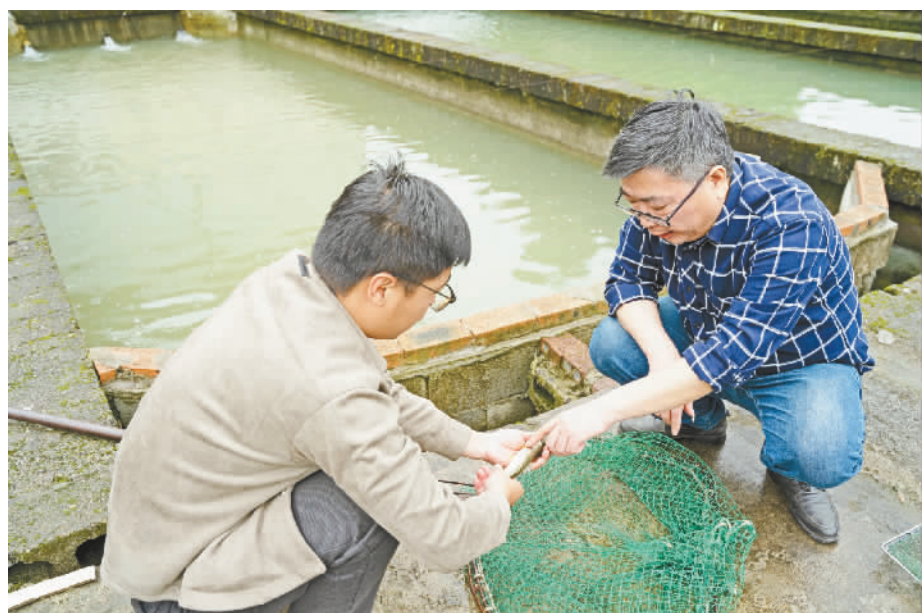
专家现场察看多鳞白甲鱼养殖情况。