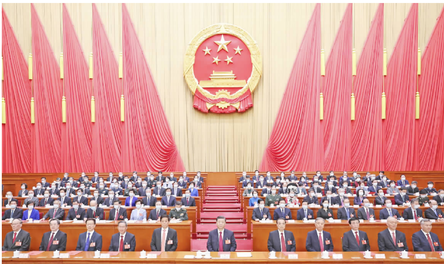
3月13日,第十四届全国人民代表大会第一次会议在北京人民大会堂闭幕。习近平等党和国家领导人在主席台就座。

新华社北京3月13日电 中华人民共和国第十四届全国人民代表大会第一次会议,在圆满完成各项议程,产生新一届国家机构组成人员后,13日上午在北京人民大会堂闭幕。