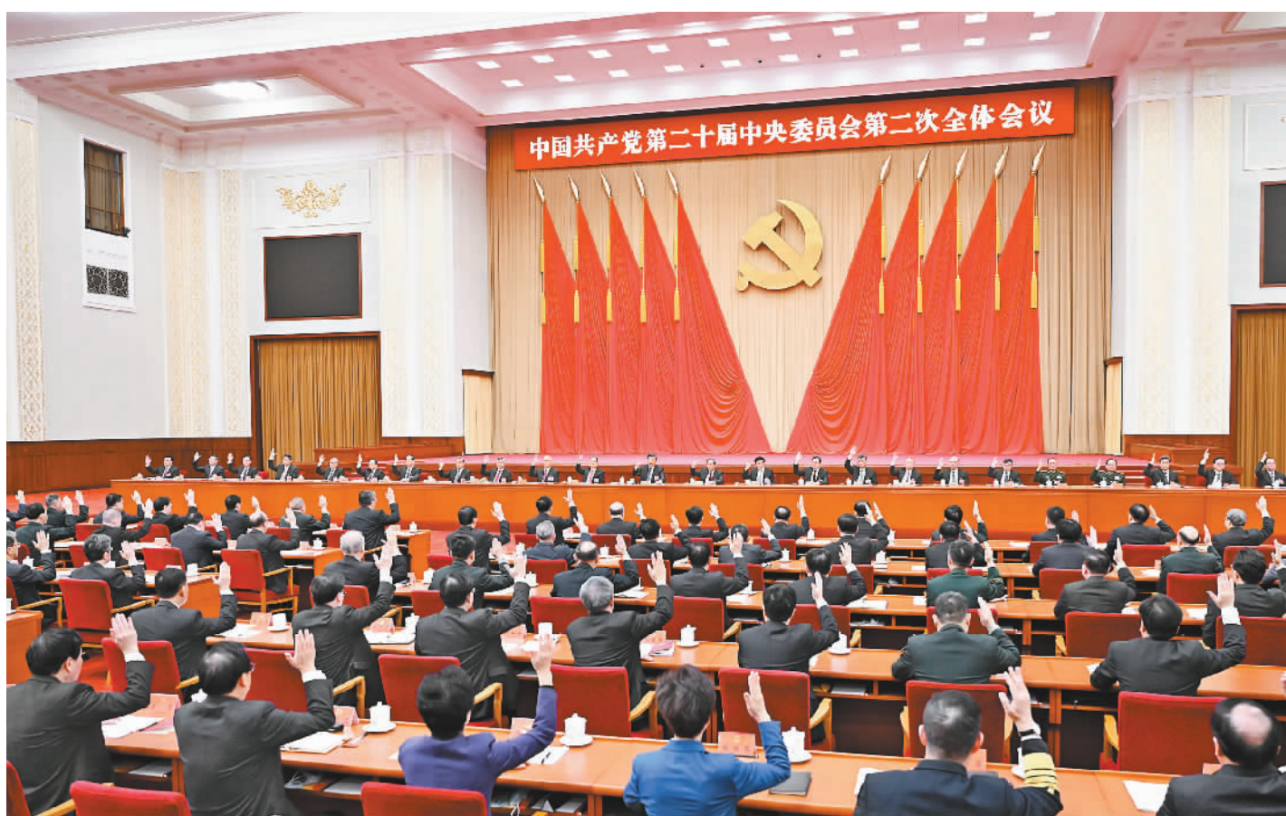
中国共产党第二十届中央委员会第二次全体会议,于2023年2月26日至28日在北京举行。中央政治局主持会议。