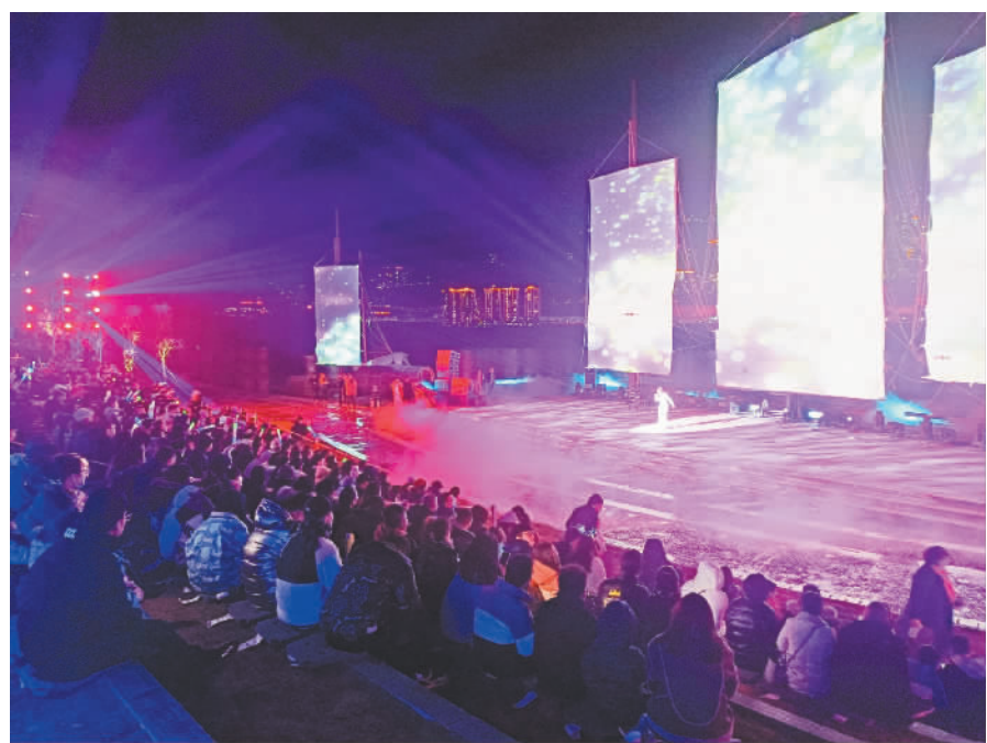
三峡里·竹枝村开村。