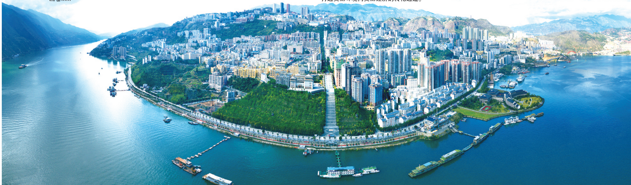
县城一隅。

绿水青山就是金山银山。今天，巫山的绿色发展不仅在于外在的美丽，更在于内涵的提升、产业的升级。立足独特的自然资源禀赋，巫山始终牢记“把下庄建设好、发展好”的殷殷嘱托，传承下庄精神，以“生态+”的理念谋划发展、“+生态”的思路发展产业，着力实现“生态美”与“百姓富”同频共振，全力打通美丽环境向美丽经济的转化通道。