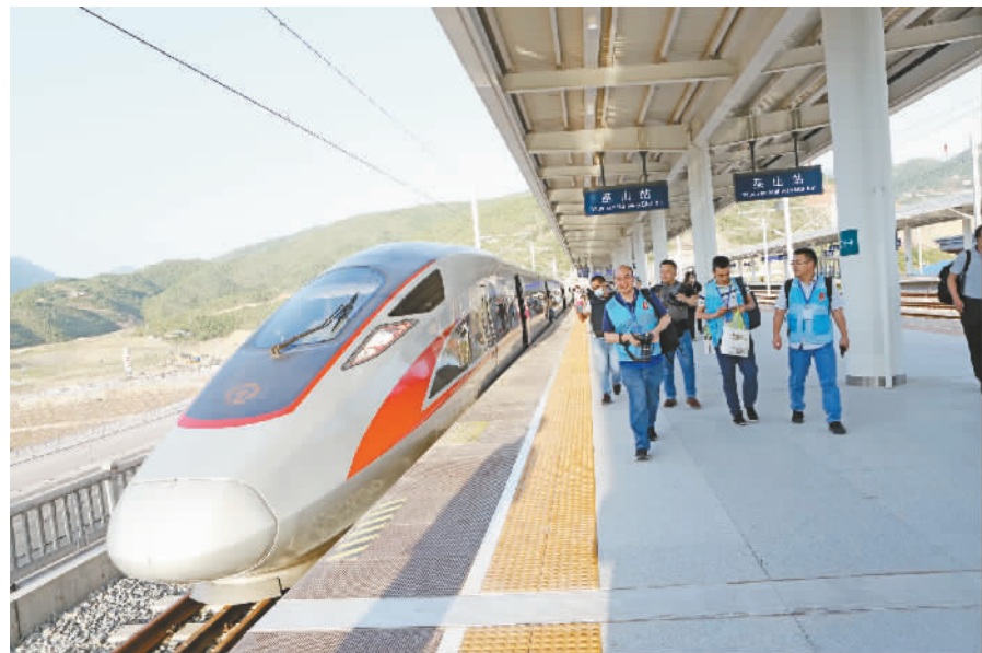
巫山高铁。

当前，巫山正全力推进下庄打造集体经济强村和党性教育基地村、全国乡村旅游重点村、全国乡村治理示范村，力争3年建成全国乡村振兴示范村。