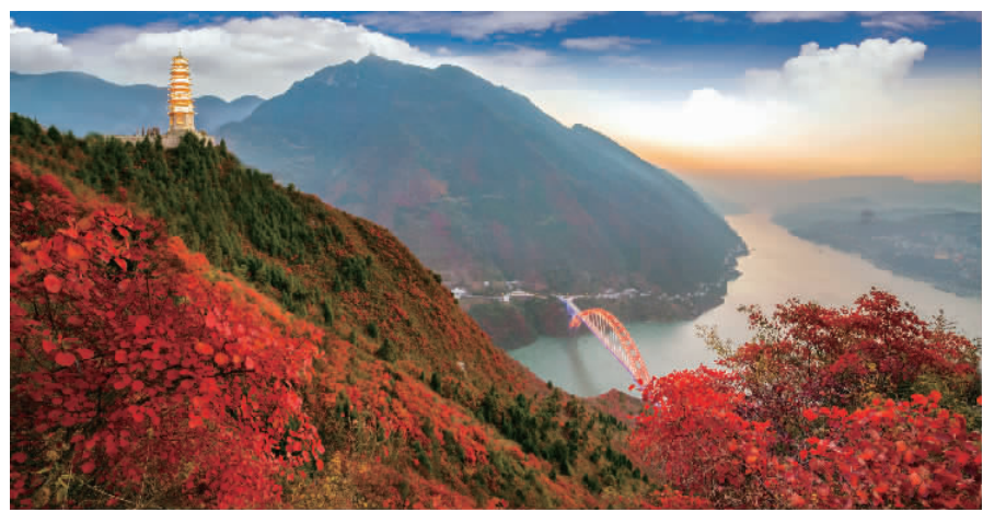
巫山红叶。