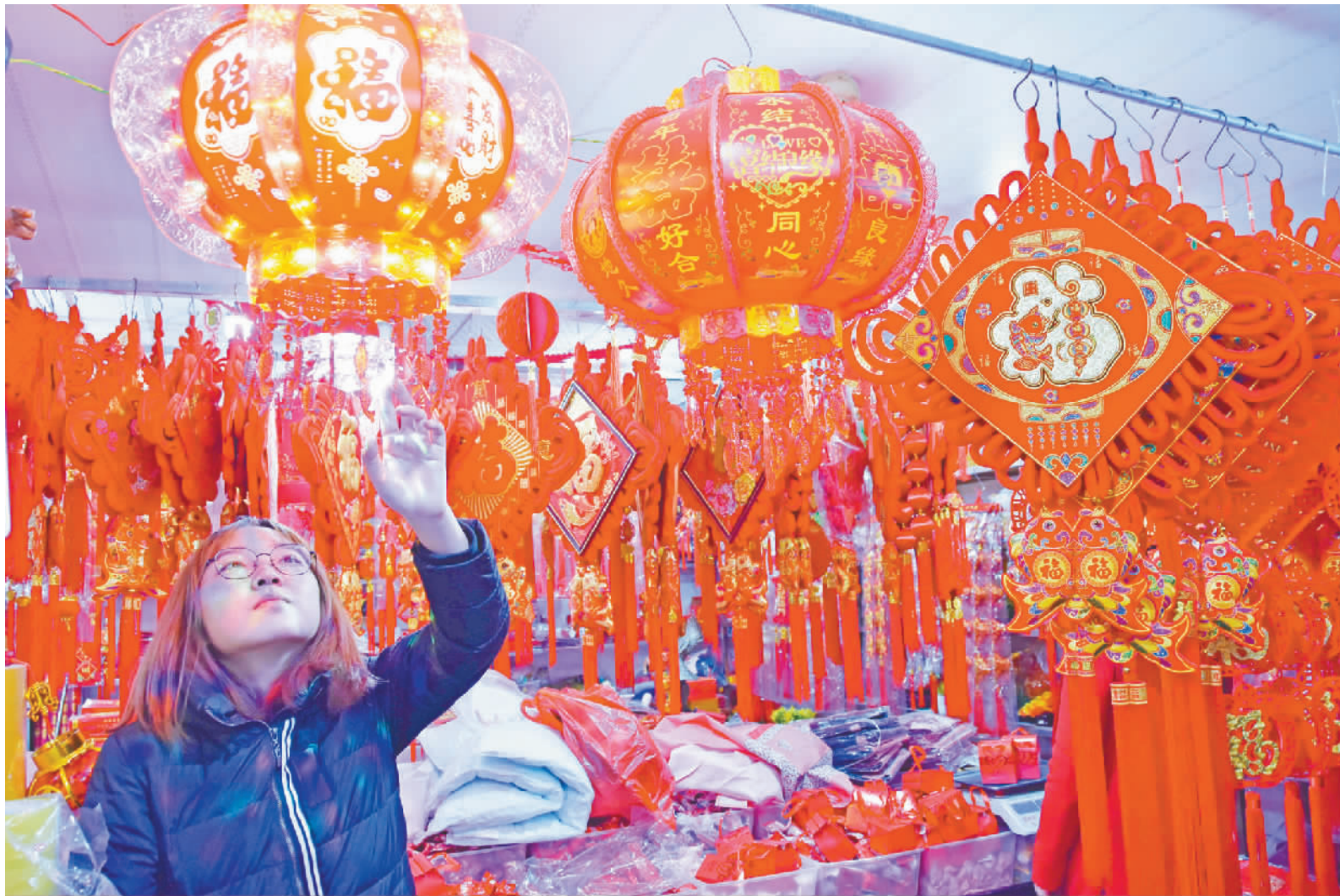
市民选购春节饰品。