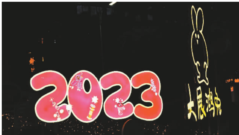
大展鸿“兔”迎春灯饰。