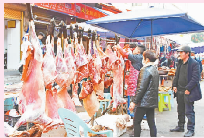
新鲜羊肉吸引市民前来选购。