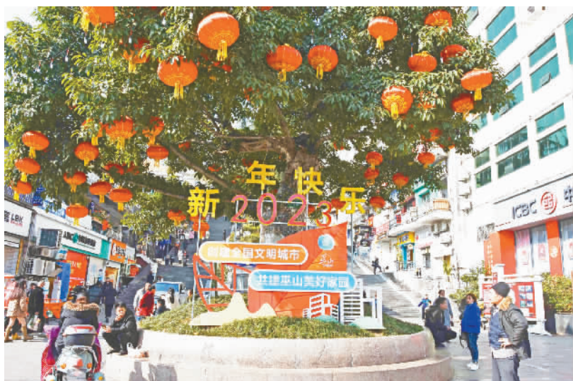
广东中路的迎新灯饰挂满树梢。