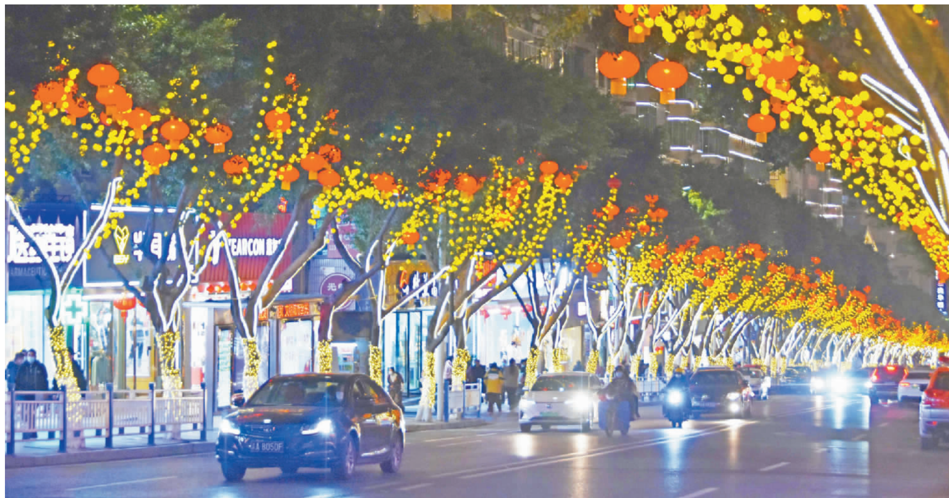
广东路的行道树上,橘黄色的灯泡与大红灯笼相互映衬。夜幕降临,霓虹闪烁,更是显现出一派喜气洋洋的新年气象。