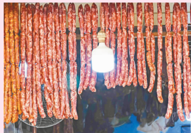
垂涎欲滴的腊香肠。