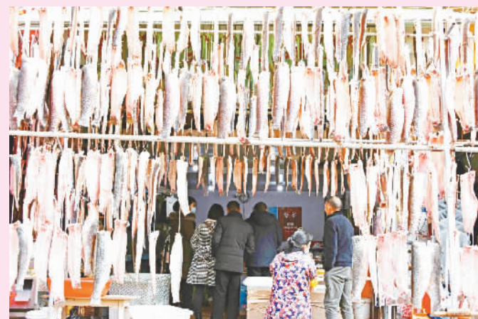
神女市场生意兴隆的干鱼门市。