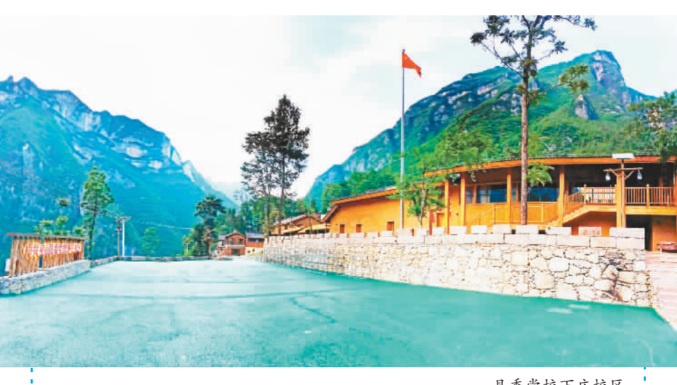
县委党校下庄校区。

一年来,巫峡·神女景区成功创建国家级文明旅游示范单位,巫山云雨康养旅游度假区成功创建为市级旅游度假区,巫峡·神女景区创5A、三峡之光·情境夜游创4A、天路下庄创4A、石上生花创3A有序推进。“三峡之光滨江消费区”获评市级文旅消费集聚区。权发村创建为市级乡村旅游重点村,竹贤寺创建为重庆市首批乡村旅游重点镇。“壮美三峡游”入选“乡村是博物馆”全国乡村旅游精品线路。下庄村入围“最佳世界旅游乡村”候选名单。