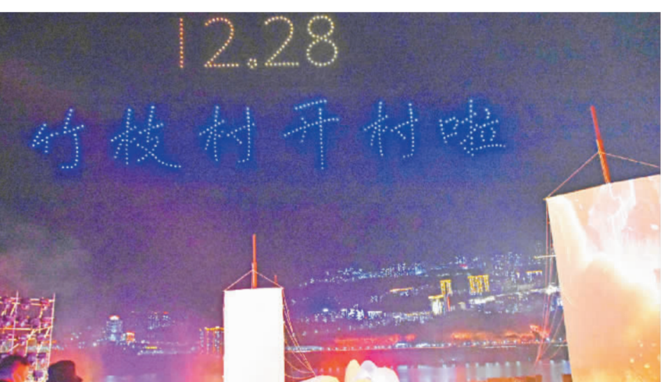
12月28日,“三峡里·竹枝村”正式开门迎客。