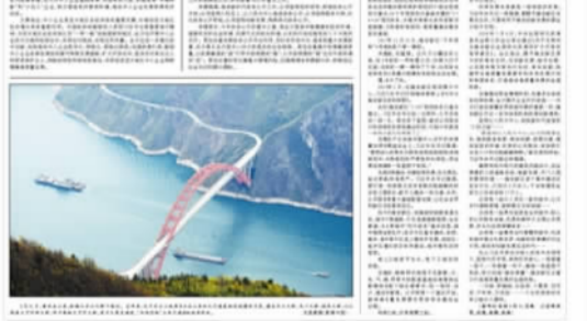
《人民日报》报道巫山。

此外,在旅游营销上,与重庆日报、人民日报等专业媒体合作,推出高铁游主题系列大型报道;与抖音等新媒体合作,推出“坐高铁 观巫山”等系列创意短视频营销,策划“神女舞”等系列创意挑战赛,实现传统媒体与新兴媒体联动宣传营销,巫山旅游持续霸占今日头条、抖音同城热搜榜,“坐高铁观巫山”累计曝光量达7.5亿人次。冠名高铁列车,在主城区“霸屏式”密集宣传“行到巫山、风景正好”高铁游,“巫山文旅创意展陈”成为热门“打卡地”。