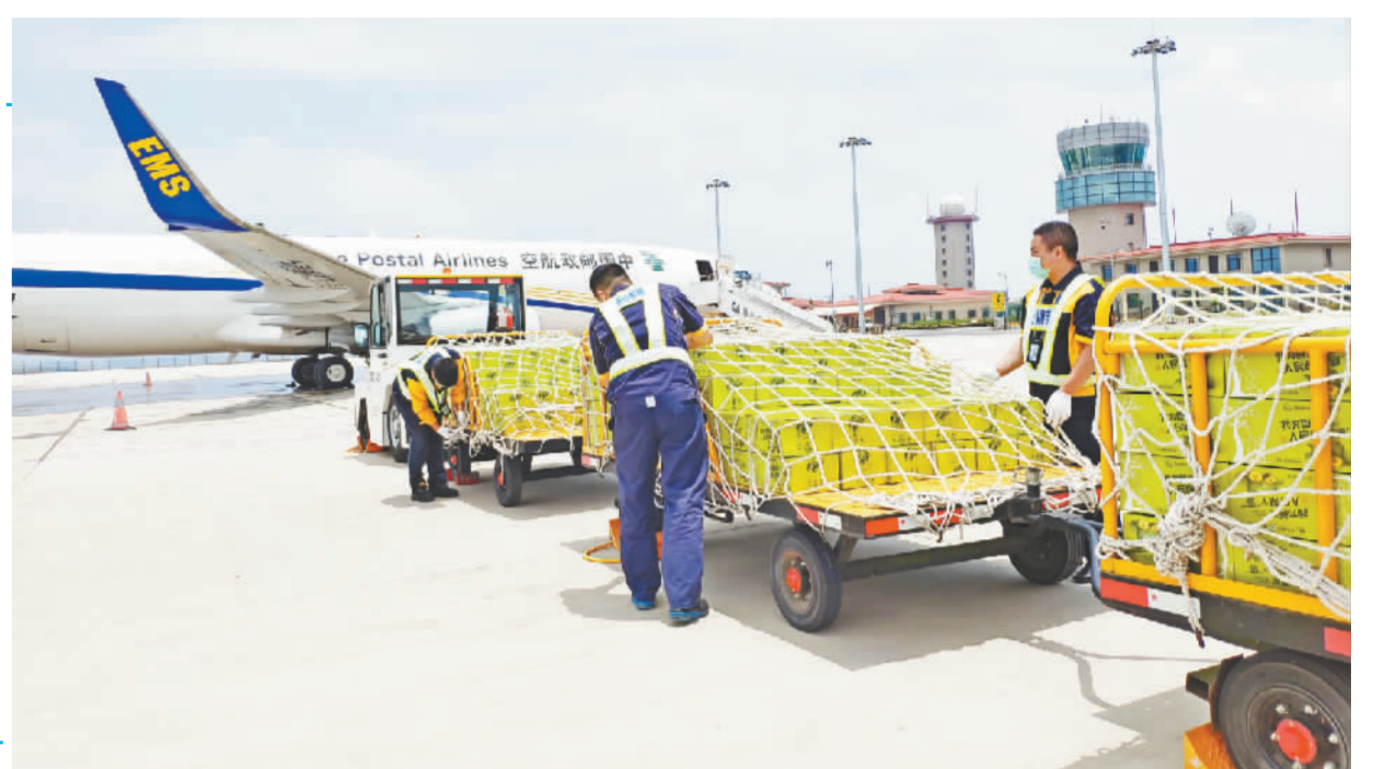
满载巫山脆李的中国邮政航空波音B737全货机,从巫山机场起飞飞往南京。

今年以来,我县以“渠道广、品牌响、销售好、保增收”为总目标。“巫山脆李”包装内市场使用率达98%以上;脆李防灾率达90%以上;次青损失率控制在10%以下;维护好市场秩序,营商环境好评率达100%;“巫山脆李”品牌推介流量上“亿”次以上,品牌影响力、好感度、美誉度大幅度提升。