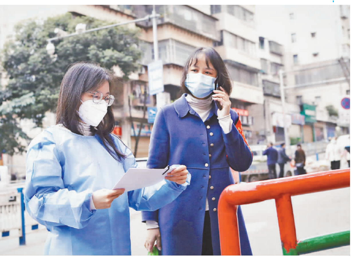
党员干部戴上志愿者袖章,深入街道、社区等抗击疫情一线,用心用情守护群众健康。