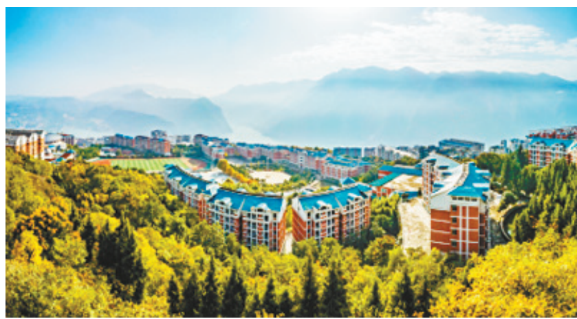
广东省援建的巫山中学教育园区。