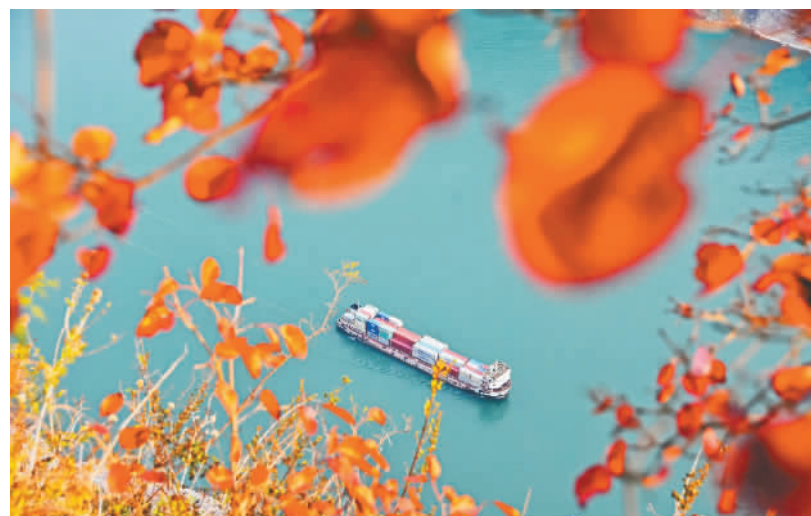
船只航行在红叶映衬下的长江巫峡水域。