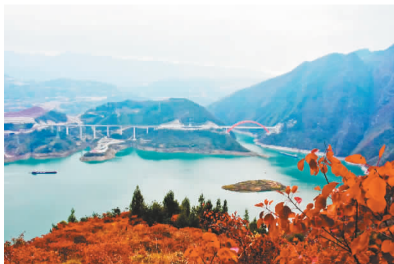
高峡平湖与红叶相映成趣。