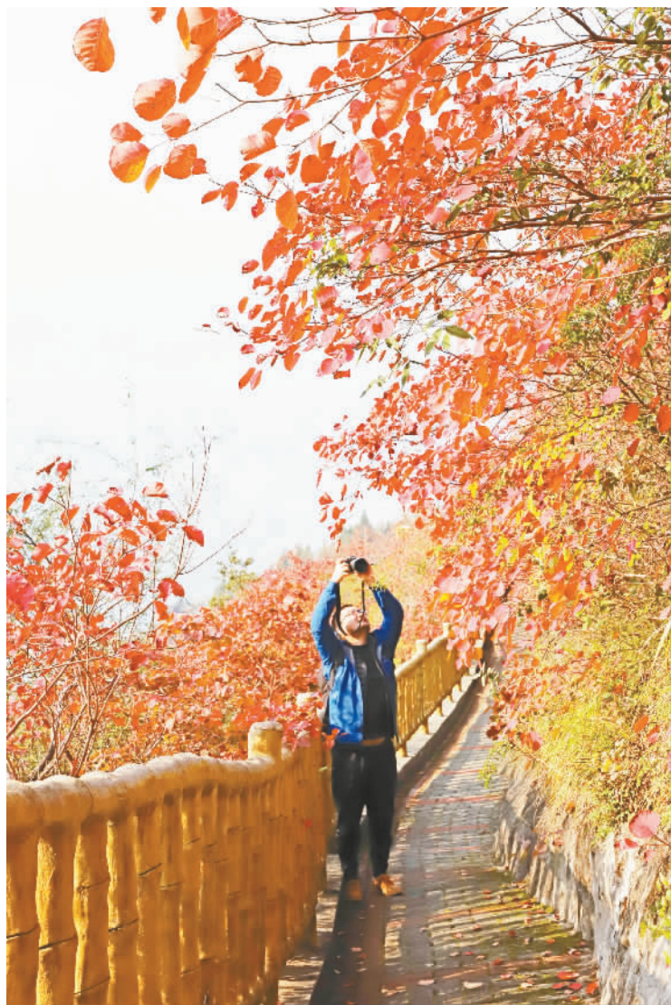
摄影爱好者拍摄红叶美景。记者 曾露 摄