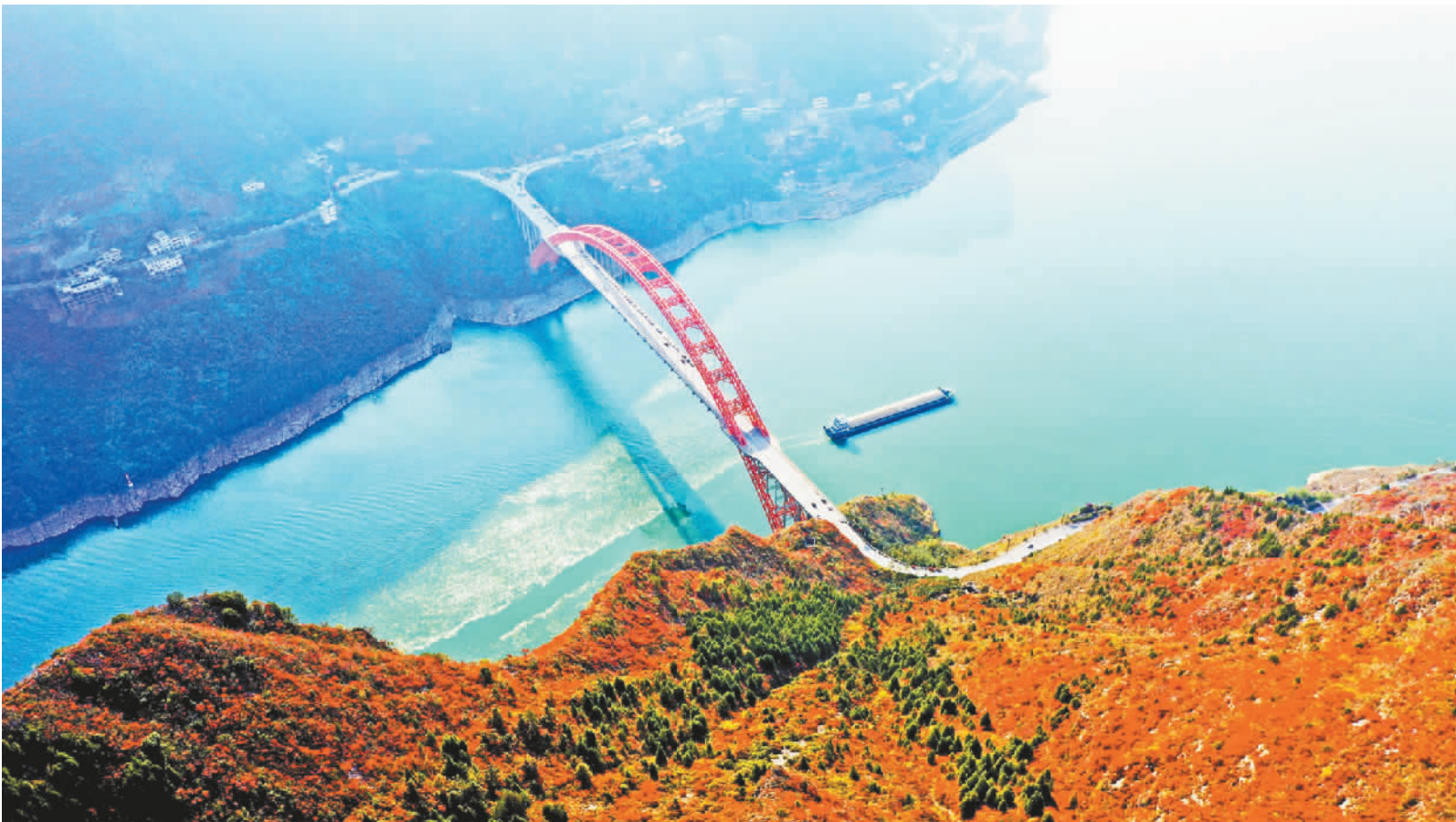
文峰景区俯瞰红叶风景。