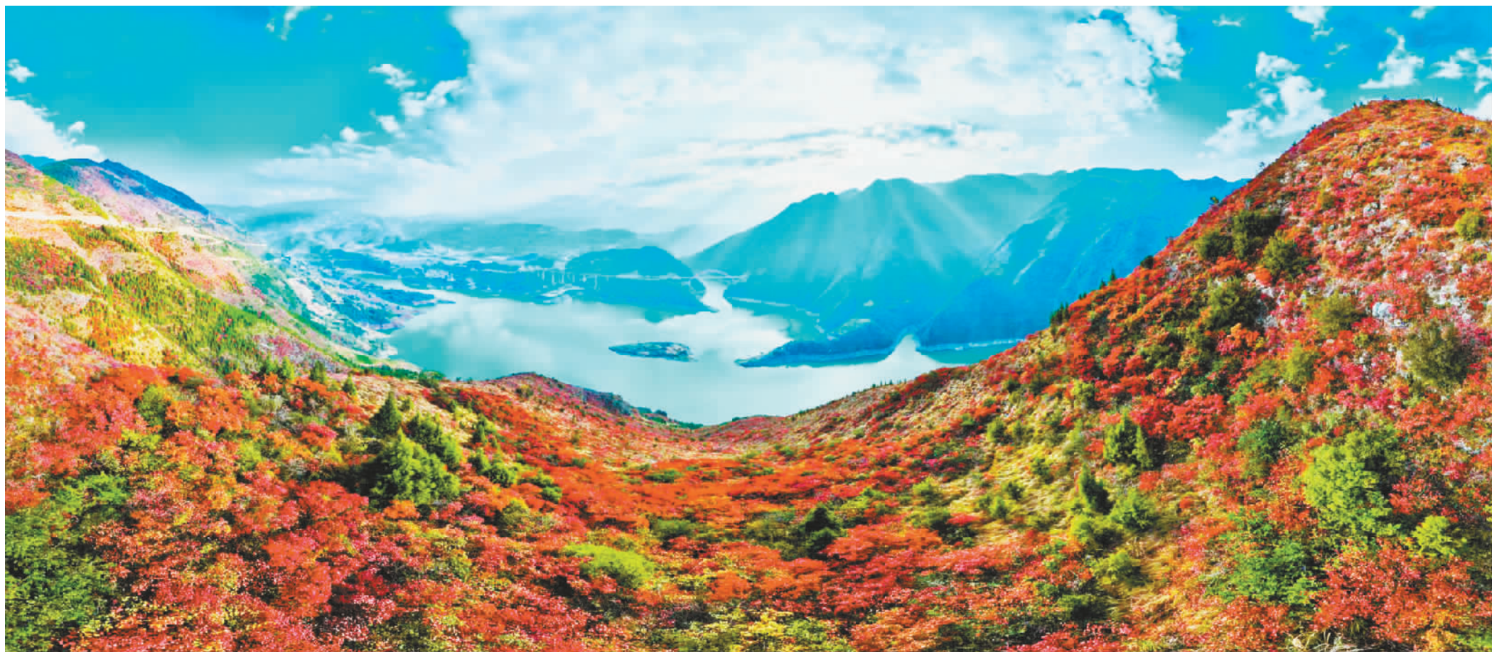
巫峡大地,漫山红遍、层林尽染。汪长征 摄

每年11月下旬到次年1月,长江巫峡两岸,红叶由高到低与碧水、险峰完美组合,构成一幅独一无二的画卷。久未外出的朋友们,巫峡“百十里红毯”已铺就,一起去打卡吧!