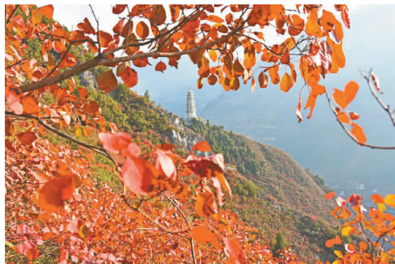
红叶映宝塔。