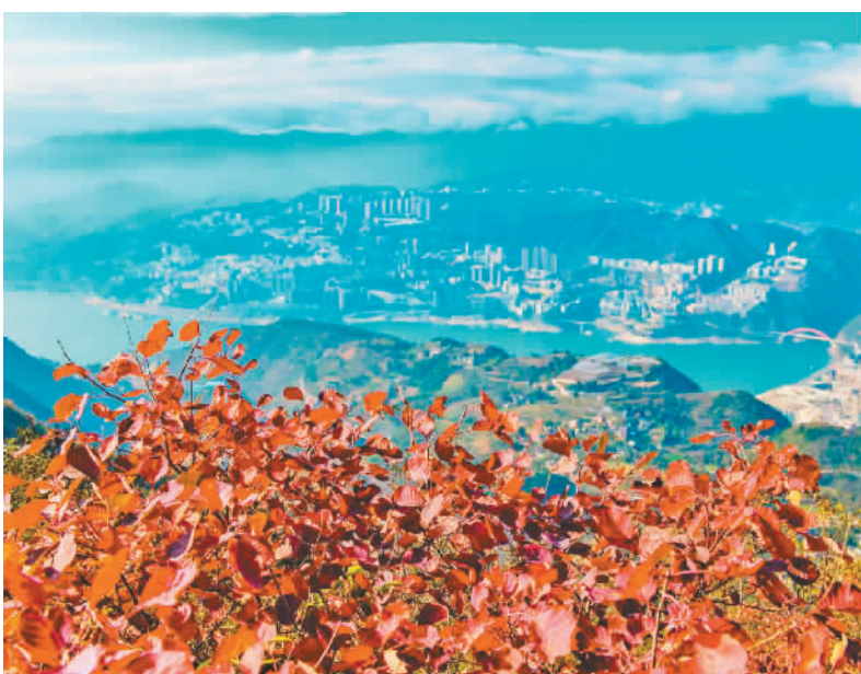
红叶与县城要相对望。