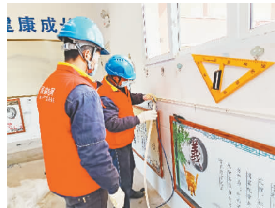
工作人员正在为安装电采暖“走线”。

本报讯（记者 王光平 文/图）入冬以来，气温骤降。地处海拔1400多米的巫峡镇春泉村温度降至零下，在得知这一情况后，国网巫山供电公司立即组织公司党员筹资1.54万元，给龙井小学春泉教学点送去并安装电采暖，保障学生们能在温暖的教室里学习。