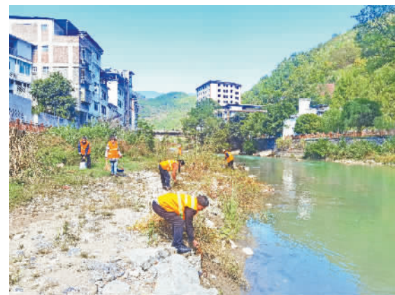
清洁人员正在清理河边垃圾。

深秋时节,漫步在平河乡场镇上,路面干净整洁,行人文明有礼,良好的环境让人心情舒畅;阳光照射下,平定河水波光粼粼,如一幅美丽的山水画。