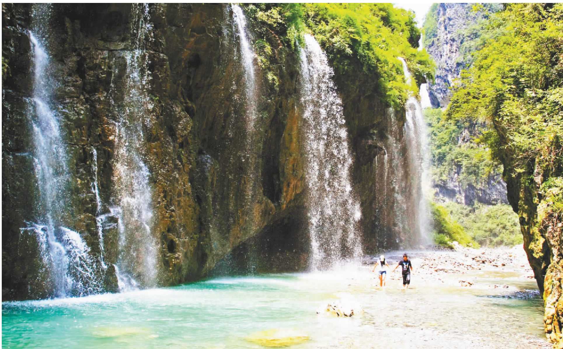
峡谷瀑布。