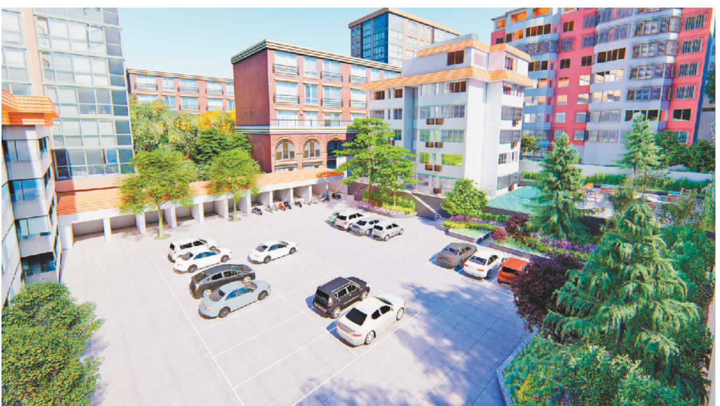
实施改造后的运营所宿舍楼(效果图)。

今年,中医院宿舍楼老旧小区改造工程实施,目前已完成楼房外立面翻新、消防设施配套等。