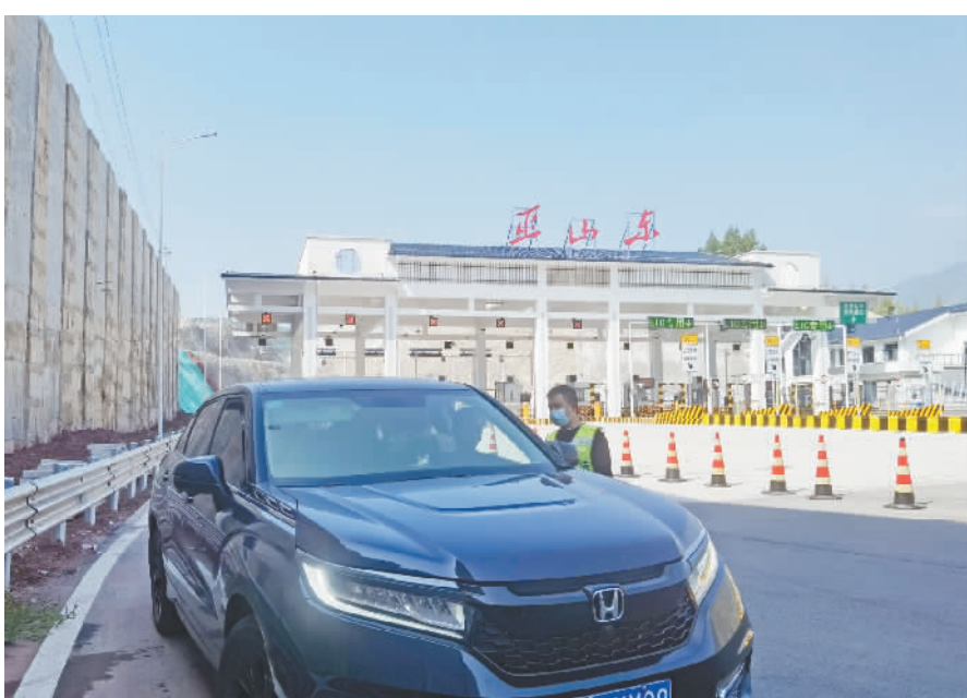
在巫山东高速出口,执勤人员正在对返巫人员进行防疫检查。

本报讯 (记者 曾露 余雨芳 文/图) 当前,我县在各交通卡口严格执行“入渝即检”的防控措施,坚决把好交通关口,筑牢疫情防线。