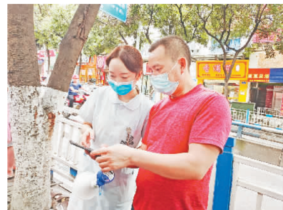
工作人员正帮助市民答疑解惑。

本报讯 (记者 陈久玲 文/图) 核酸检测是疫情防控“早发现”的重要手段。为进一步方便群众出行核酸检测,同时满足秋季开学核酸检测需求,巫山城区所有采样服务点近日均采取增加人手、延长服务时间等措施,尽最大力量满足市民、师生核酸检测需求。