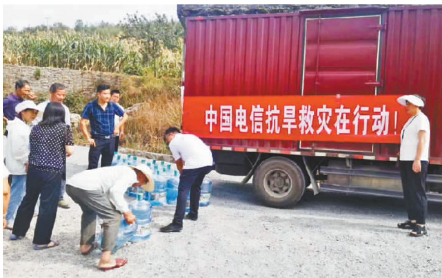
中国电信巫山分公司官渡支局积极开展送水行动,解决群众饮水难题。

本报讯 (记者 曾露) 入夏以来,高温不断,官渡镇一个多月少有“透雨”,尚家村1社、5社因水源不足,群众遇到饮水困难。