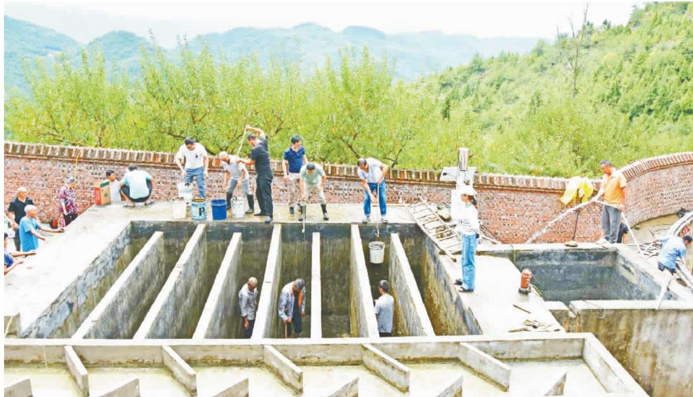
各级干部与村民们一起清理过滤池。

本报讯 (记者 王忠虎 雷行星文/图) 8月29日,在建平乡云台村2社,只见村民们在一口水池旁,手持铁锹、扁担、水桶、抽水泵等工具,或抽水,或铲淤泥,或在用水管冲洗,现场呈现一派热火朝天的景象。原来,他们是在对 this 口被取名为龙泉池的水池开展清淤工作。