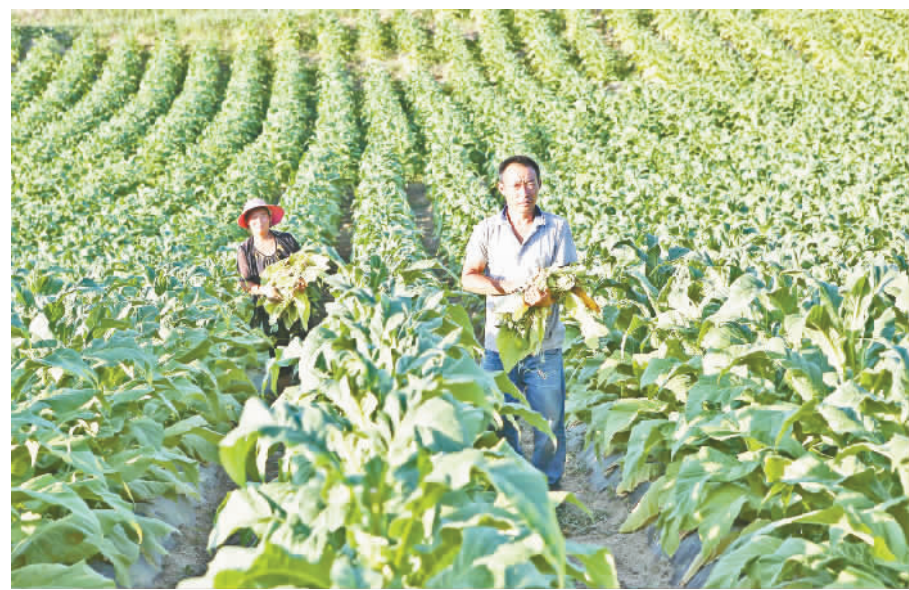
笃坪乡狮岭村村民正在管护烤烟。

山高坡陡，地广人稀，是笃坪的区域特点。自古以来，靠山吃山的笃坪人，以种植红薯、玉米、土豆为主。