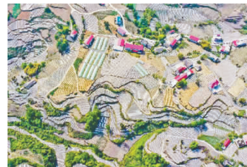
笃坪乡向鸭村田园风光。

产业兴则乡村兴，产业兴则百姓富。笃坪乡的生态特色产业，撑起了村民的“致富伞”。过上好日子的村民又改善着生活的质量。