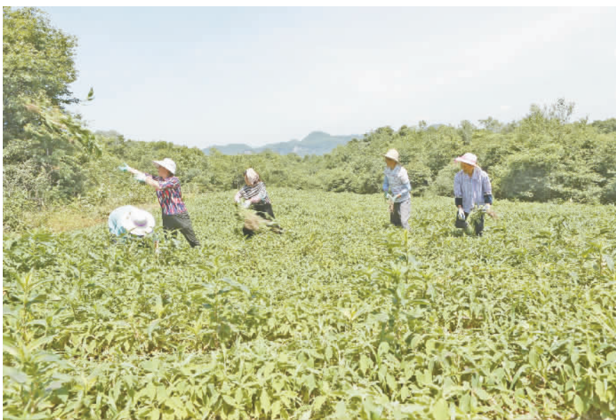
鹤溪村村民在管护中药材。

成立中药材种植专业合作社加快发展。已形成“公司+基地+农户、专业合作社+基地+农户、公司+专业合作社+基地+