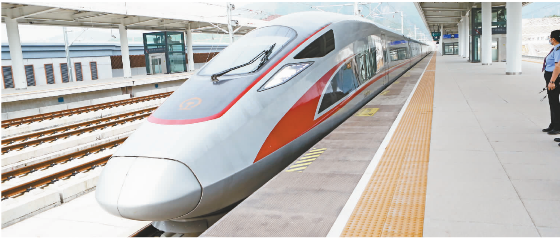
高铁停靠在巫山站。

蜀道难，难于上青天。以往，到巫山游玩，必须乘舟而入，历经蜀道之难，方能仰观山、俯察水；而今，坐高铁到巫山，天堑变通途、城景融合、城市更新，给游客带来了全新的体验。 “云绕奇峰、雾锁平湖。”站在巫山高铁站的广场上，放眼望去，以巫山字母“W”为造型的候车大厅，像雄鹰一样，欲展翅高飞。 候车大厅里，其主题墙运用层叠的装饰手法与线形光源相结合，辅以格栅造型，以更加立体的方式来呈现巫山“云绕奇峰、雾锁平湖”的梦幻景象。同时将“山、水、云、雨”巧妙地转换成“简笔”形态，通过排列组合形式嵌入风口之中，展现了飘渺的神秘之美。