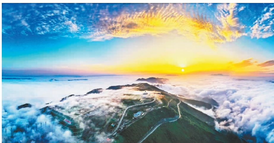
重庆巫山机场。

2019年8月16日，巫山机场正式通航。目前，巫山机场与重庆主城区的交通时间仅为55分钟。已累计开通8条航线，辐射成都、武汉、海口、广州等10个城市，巫山与世界