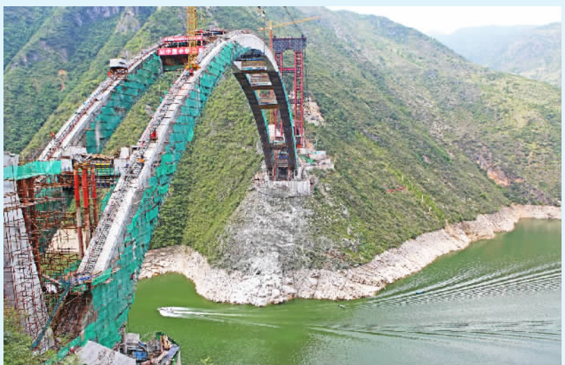
郑渝高铁大宁河特大桥建设。