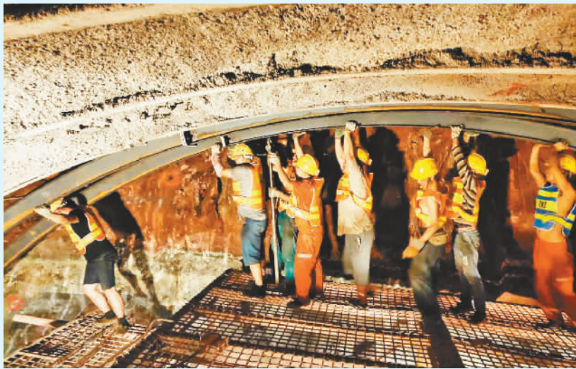
所有工人通力合作,完成巫山隧道内一榀钢架拼装。