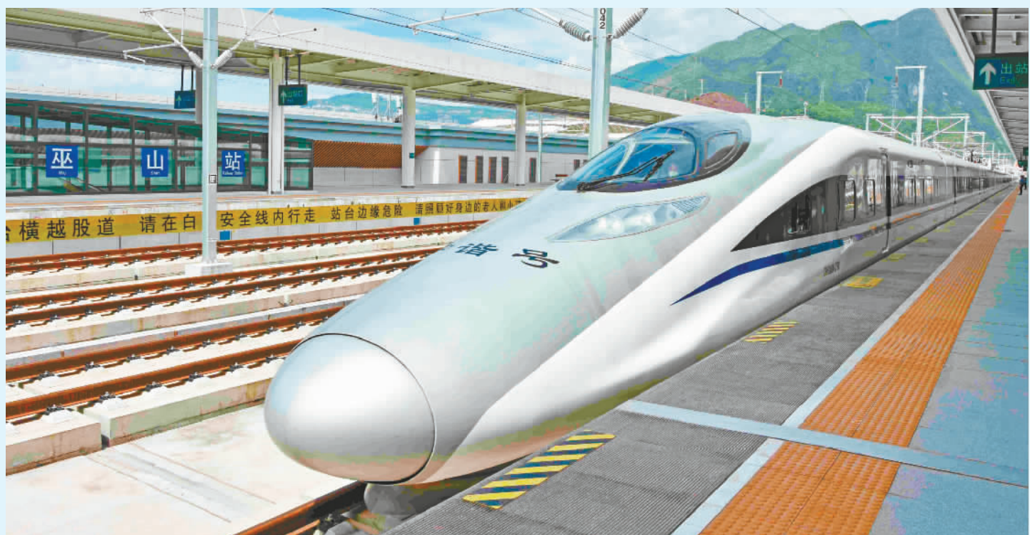
2022年6月20日早上9点01分,从重庆北站始往巫山站的第一辆高铁停靠在巫山站台,这标志着巫山正式进入“高铁时代”。