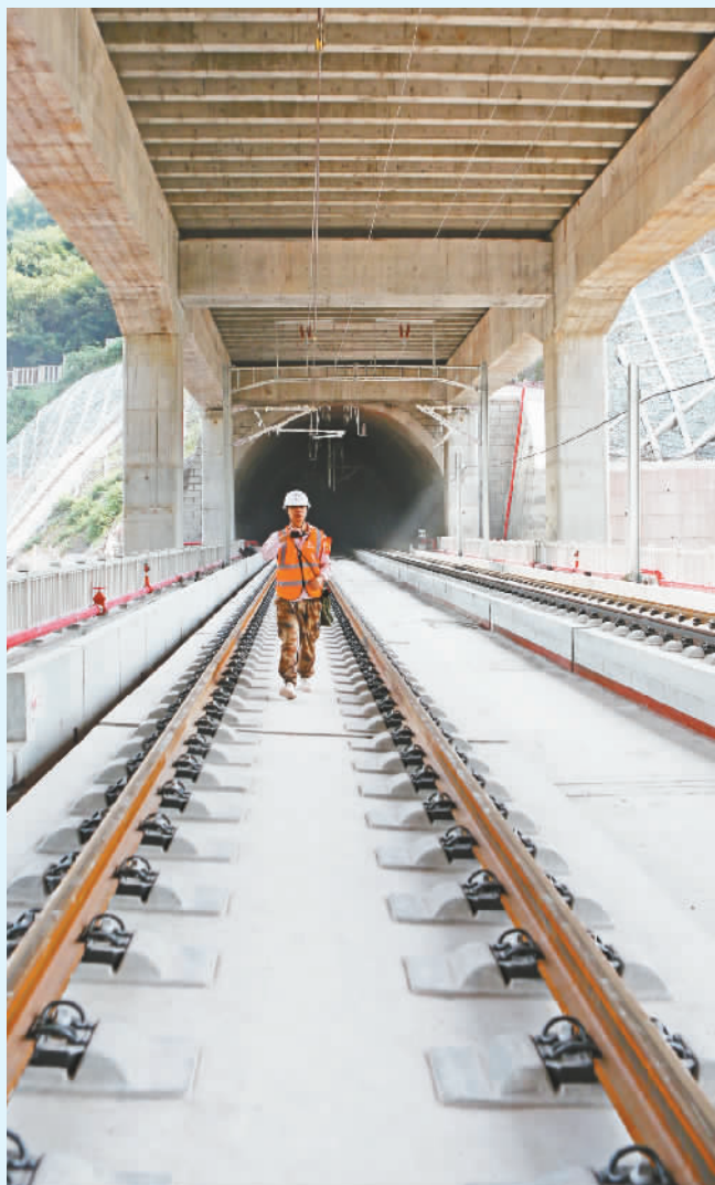
2021年9月23日,三溪乡境内的郑渝高铁巫山段香树湾隧道轨道铺设完成,标志着郑渝高铁重庆境内已全部完成正线轨道铺设。