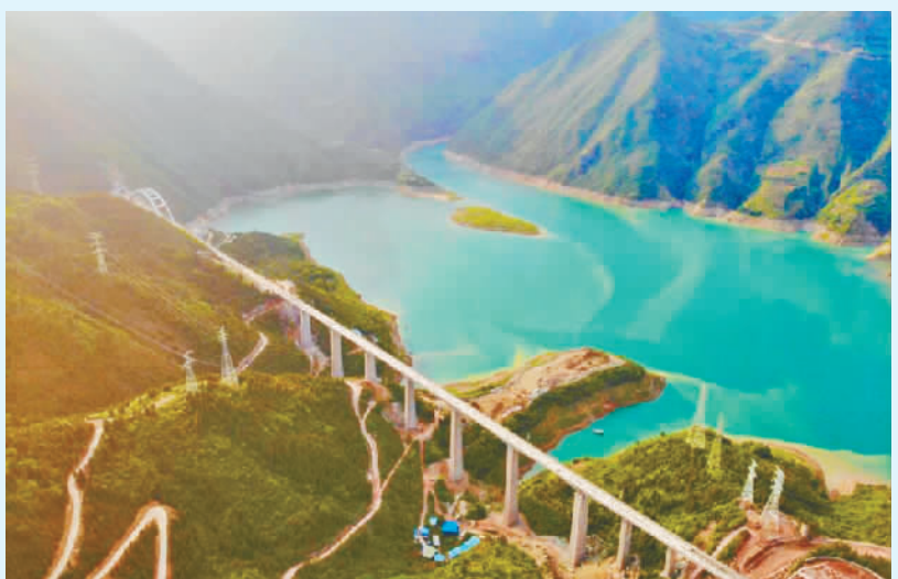
2020年6月11日,桂花村双线特大桥全桥合龙。