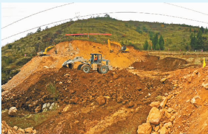
2016年11月30日,郑万高铁巫山段正式开工建设。