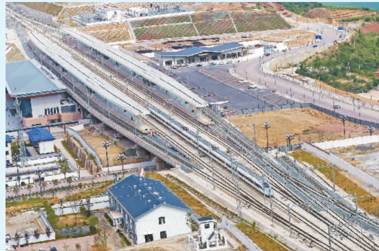
郑渝高铁建成后,列车进行试运行检测。