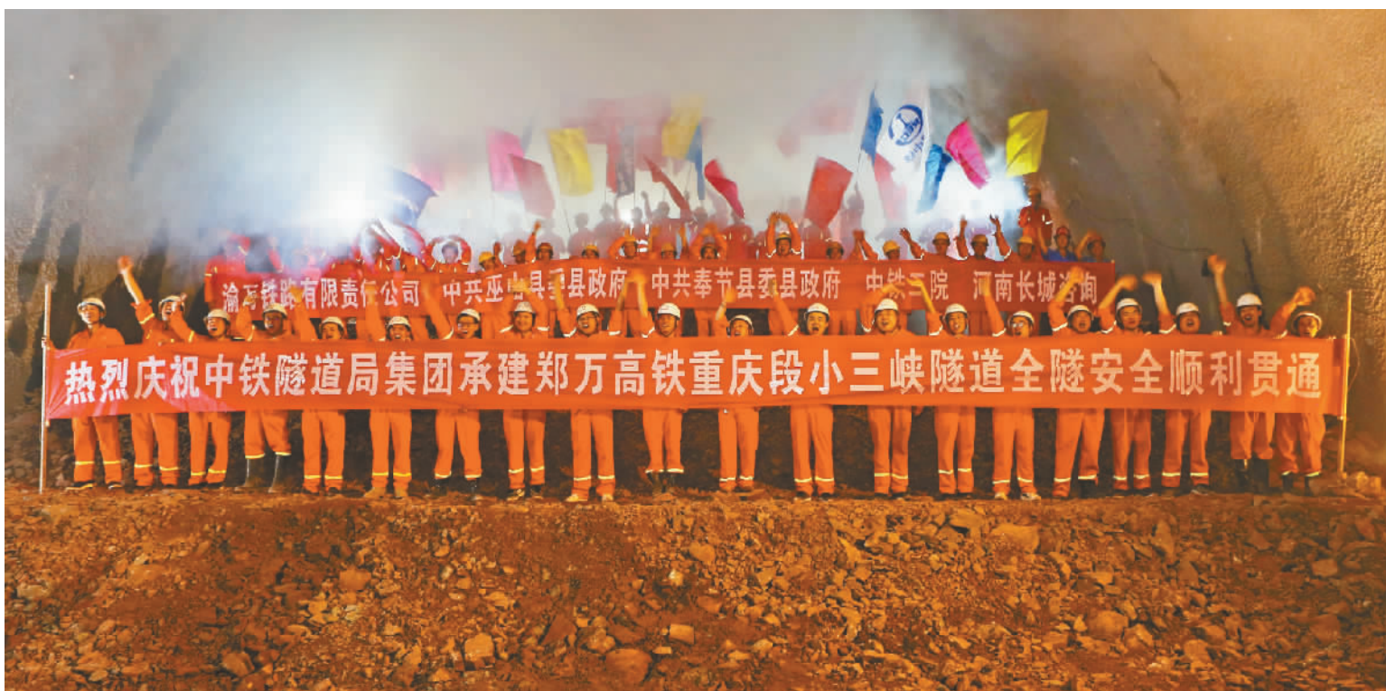
2020年7月26日,郑渝高铁最长隧道小三峡隧道贯通。

郑渝高铁是我国“八纵八横”高铁网的重要组成部分,形成了我国西南地区外出的又一快速客运通道,串联起嵩山少林寺、襄阳古隆中、神农架原始森林、奉节白帝城、巫山大小三峡等众多著名旅游景点。这一高铁的全线贯通,将进一步完善华中、西南地区铁路网结构,极大便利沿线人民群众出行,促进旅游资源开发和产业发展,释放襄渝普速铁路货运能力,更好推动地区物流发展,对加快中原城市群、成渝地区双城经济圈的发展,具有十分重要的意义。