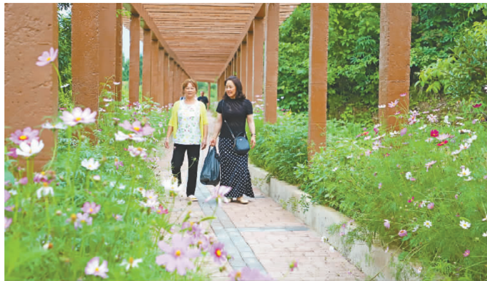
◀ 大塘村美丽廊桥。

如今，加上污水处理厂的运行，人们的环保意识不断增强，官渡河水质达到国家Ⅰ级标准，不少河段还出现了“鱼翔浅底竟自由”的景象。