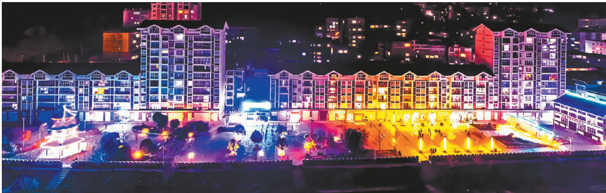
滨河广场夜景迷人。

破旧的石磨、陈朽的木板，个个都是别致的景观。官渡镇通过实施“绿色家园、生态田园”建设，实现了乡村建设与自然生态环境有机融合，形成了一批独具特色的乡村旅游点。