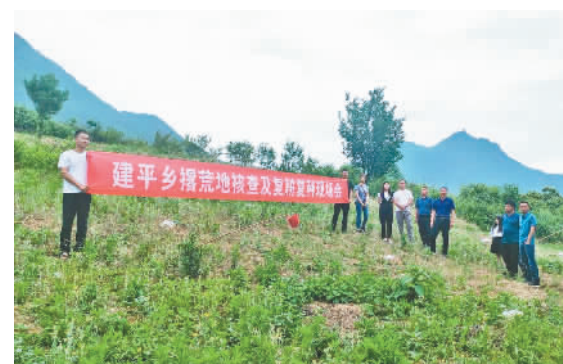
撂荒地核查工作现场。

本报讯(记者 曾露 通讯员 周春燕 文/图) 近日,建平乡集中开展撂荒地清查和复耕复种工作,全面整治利用撂荒地,确保农业生产健康发展。