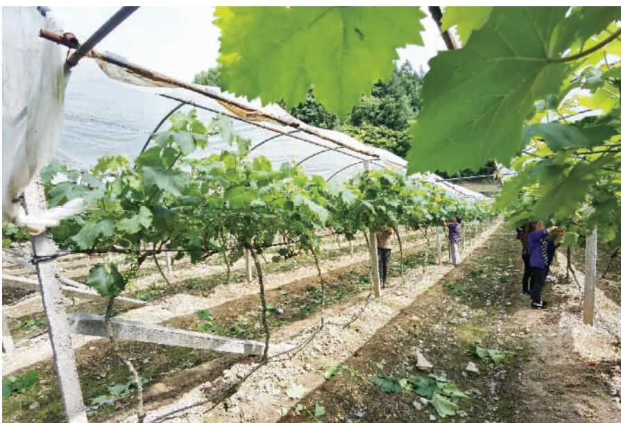
葡萄基地内,村民进行疏果。