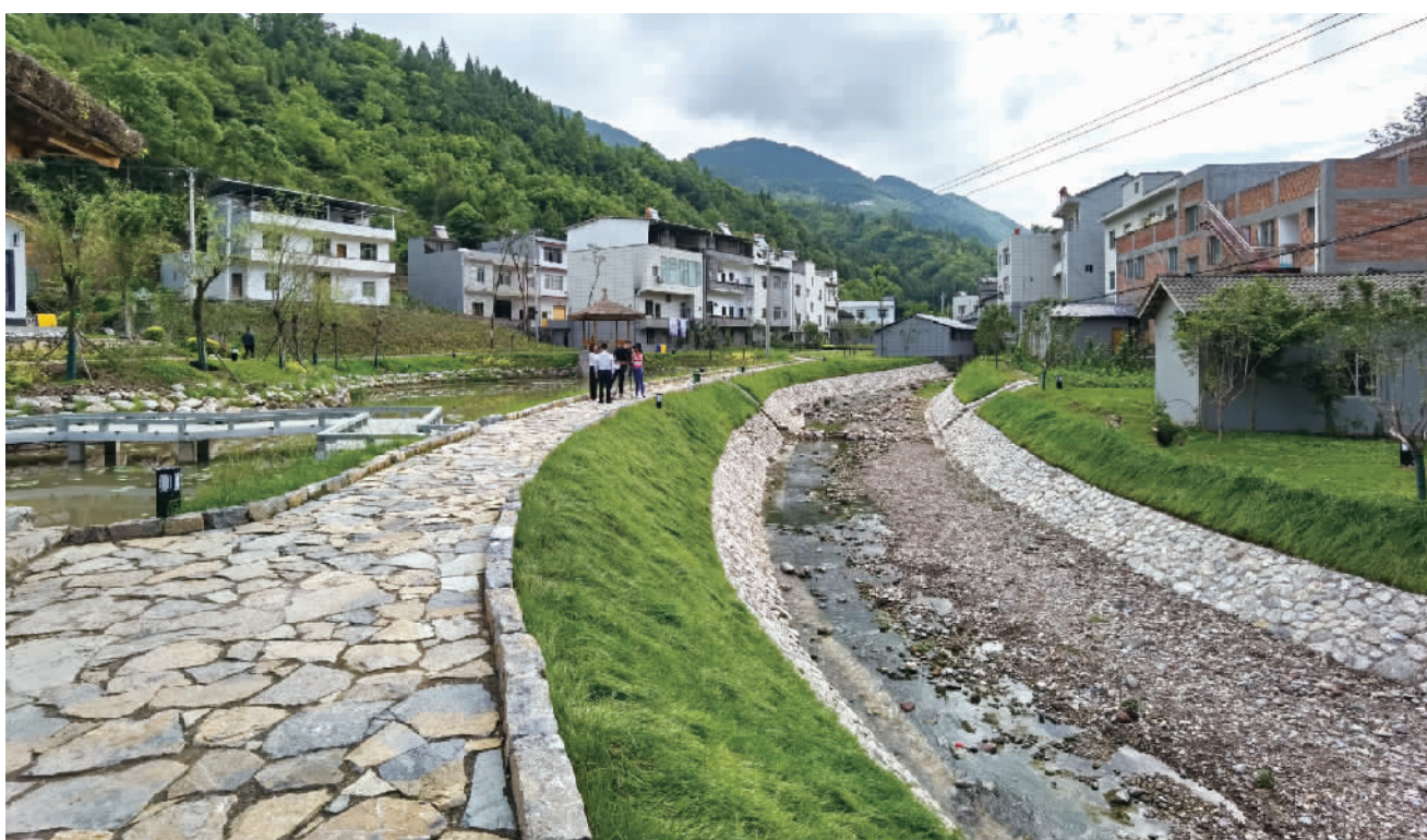
河沟宽了,水变清了,岸边绿了。

本报记者 向君玲 陈久玲 杨新宇 文/图 花儿幽香、果树繁茂,水儿清澈、天空湛蓝。