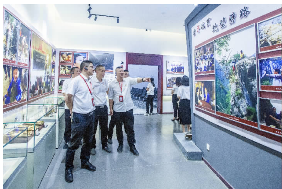
旅发集团第一批学员参观事迹陈列馆。

本报讯 (记者 郝燕来 文/图) 为学习下庄精神,践行初心使命,推动巫山旅游高质量发展,5月6日至7日,旅发集团举行了“学习下庄精神,践行初心使命”暨支部主题党日活动。