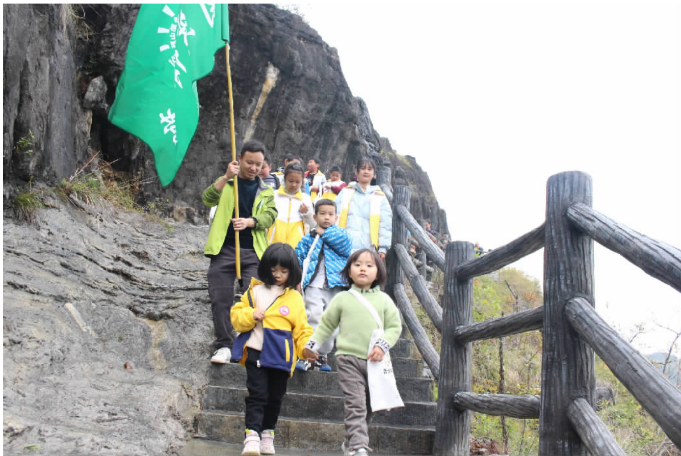
参加活动的孩子们观赏家乡美景。

本报讯（记者 王忠虎 文/图）3月26至27日，由双龙镇党委政府指导，重庆市体彩中心支持，巫山县乡助山野公益发展促进会主办，巫山县三峡社会工作服务中心协办的“公益体彩 乡助山野”青少年耕读计划自然体验营，在双龙镇安静村神鱼谷社区成功举办。