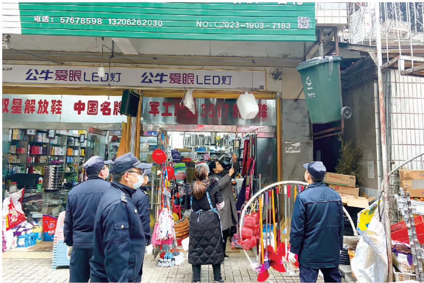
城管局执法人员整治乱堆乱建。

本报讯(记者 余雨芳 实习记者 吴友琼 文/图) 为进一步规范提升城市秩序,给广大市民营造更整洁靓丽的居住环境,3月18日开始,县城管局在城区组织开展市容环境秩序整治行动。