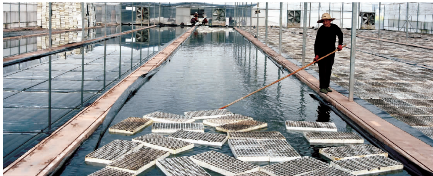
村民们正忙着开展烤烟漂浮式集中育苗。