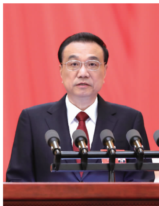
国务院总理李克强代表国务院向大会作政府工作报告。