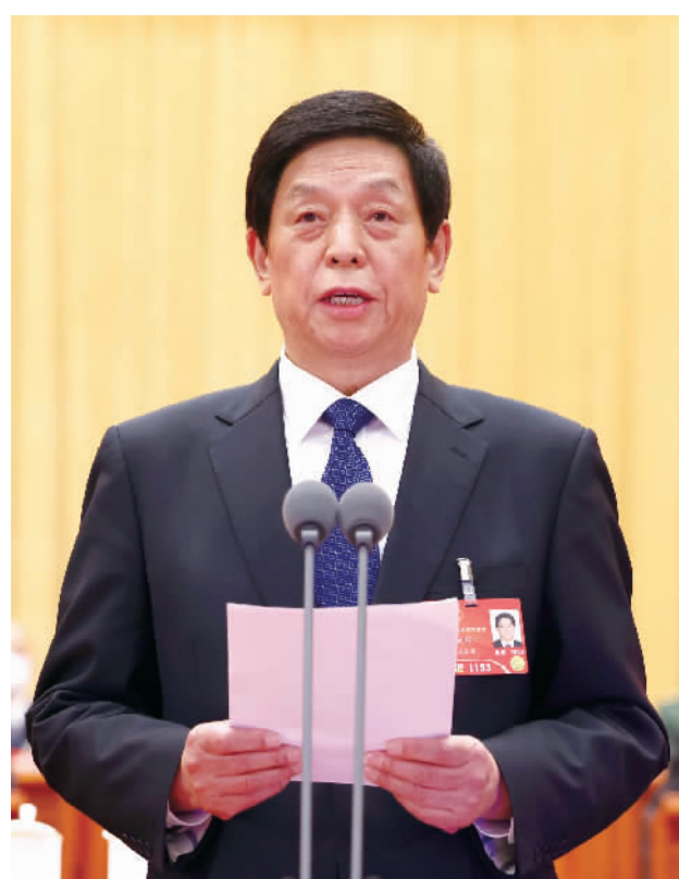
大会主席团常务主席、执行主席栗战书主持大会。

新华社北京3月5日电 第十三届全国人民代表大会第五次会议5日上午在北京人民大会堂开幕。近3000名全国人大代表肩负人民重托出席大会,认真履行宪法和法律赋予的神圣职责。