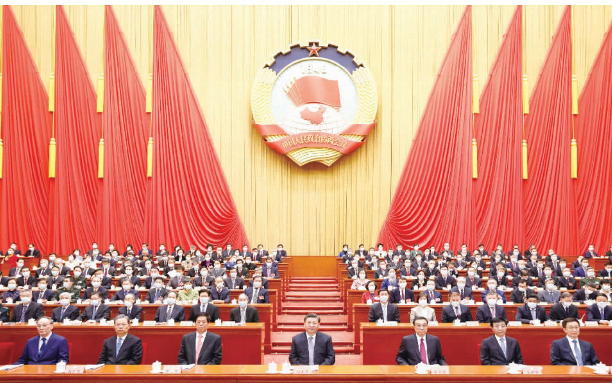
3月4日,中国人民政治协商会议第十三届全国委员会第五次会议在北京人民大会堂开幕。这是习近平、李克强、栗战书、王沪宁、赵乐际、韩正、王岐山在主席台就座,汪洋代表政协第十三届全国委员会常务委员会向大会报告工作。