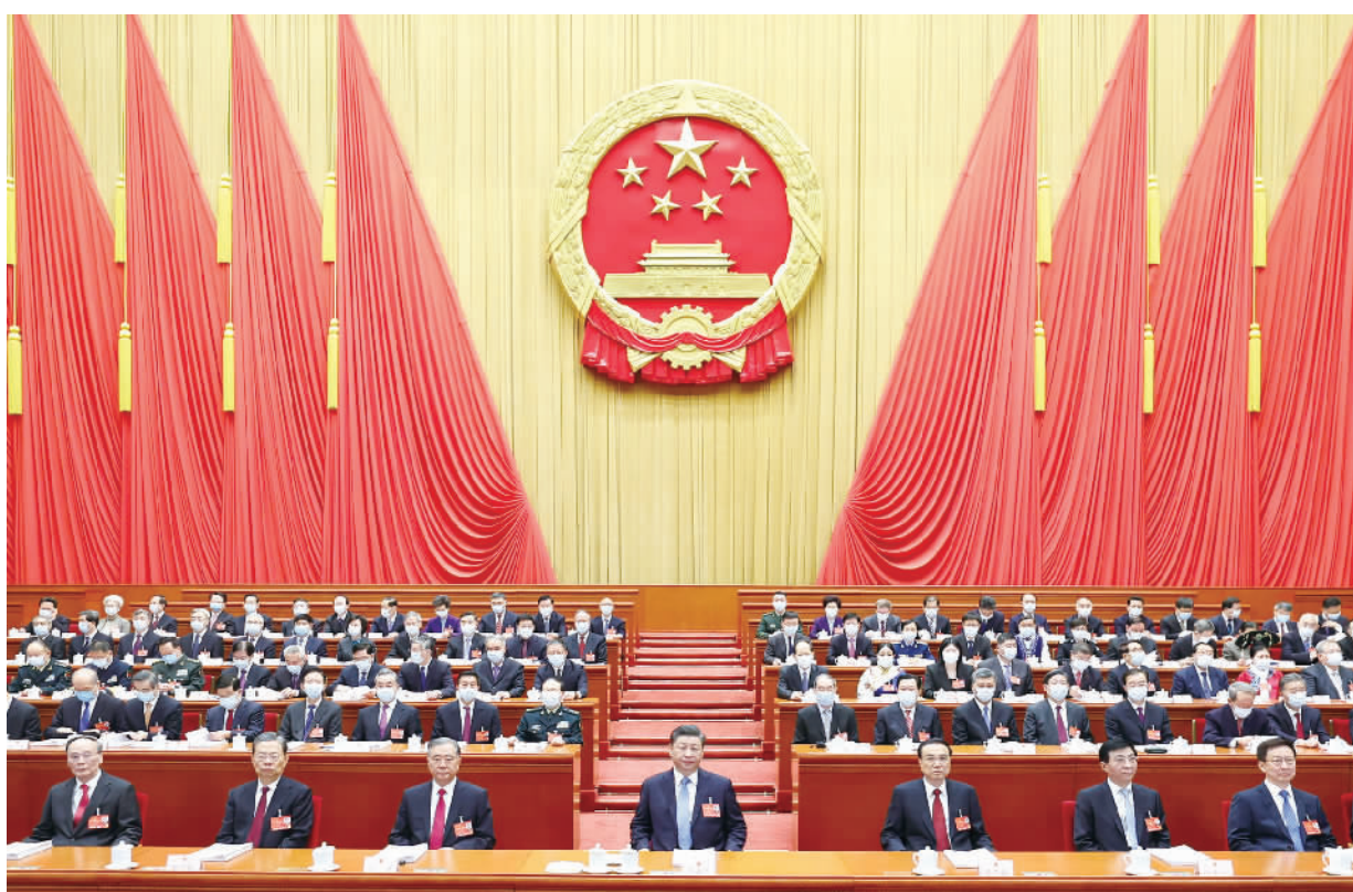
3月5日,第十三届全国人民代表大会第五次会议在北京人民大会堂开幕。党和国家领导人习近平、李克强、汪洋、王沪宁、赵乐际、韩正、王岐山等出席,栗战书主持大会。新华社记者 鞠鹏 摄

听取关于地方组织法修正草案、关于十四届全国人大代表名额和选举问题的决定草案的说明等