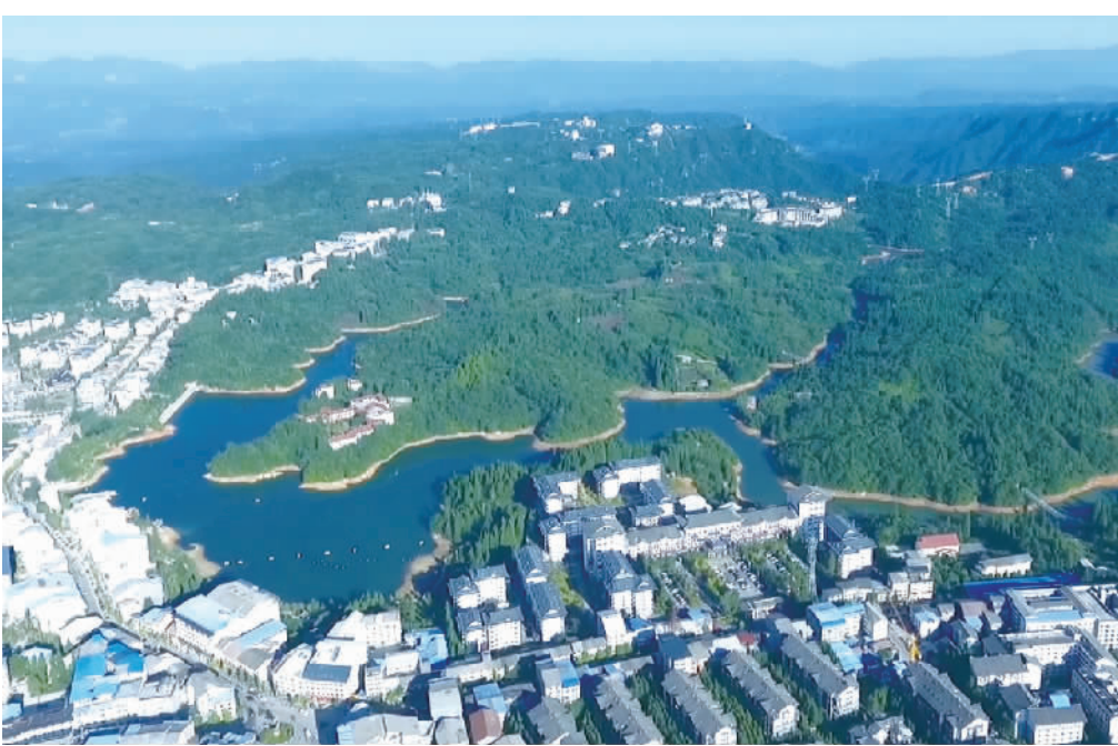
石柱黄水镇良好的水生态环境。