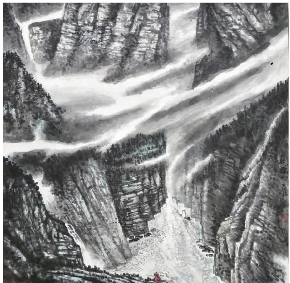
《晨雾》唐志林(中国画)