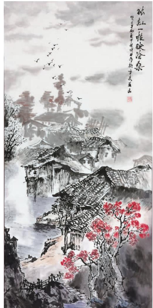
《独红一枝》刘成平(中国画)