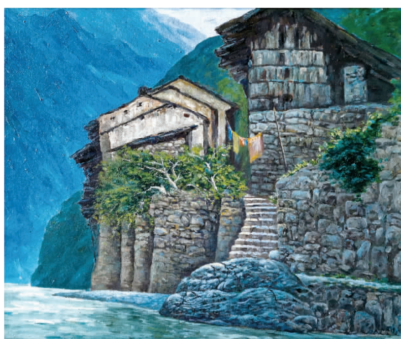
《宁河小景》谭少华(油画)