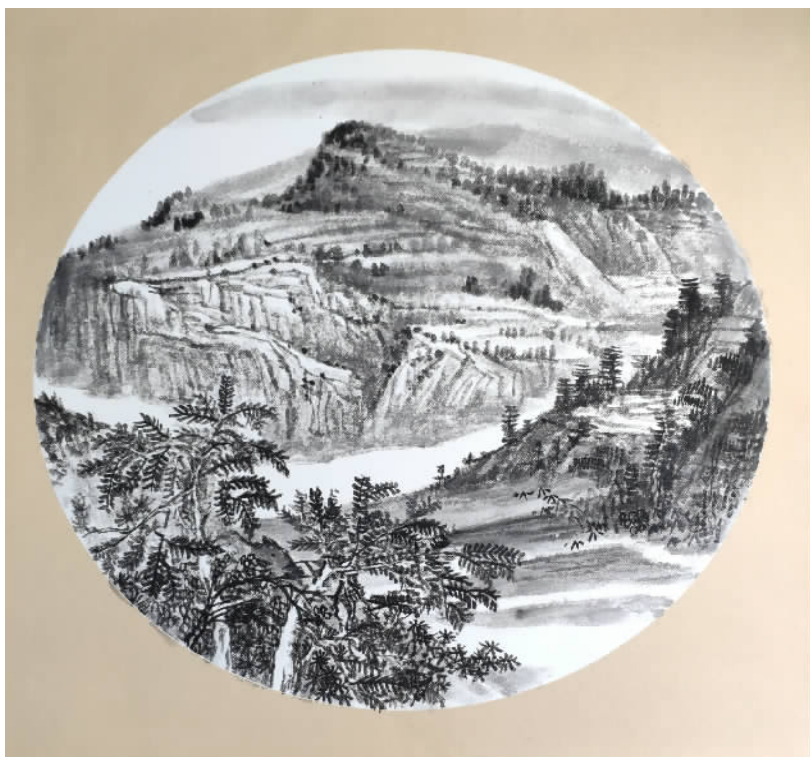
《龙门桥小》程合亿(中国画)