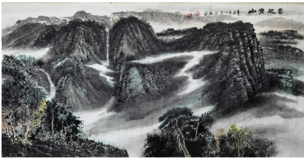
《青山起雾》唐志林(中国画)