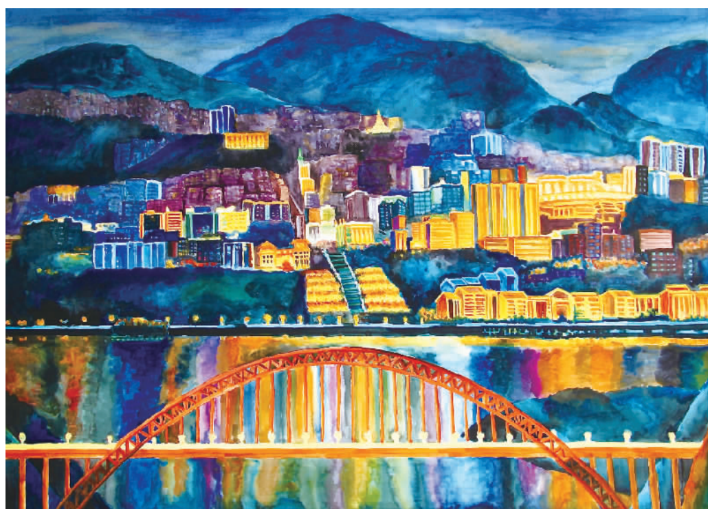
《巫山夜色》陈章(水彩画)