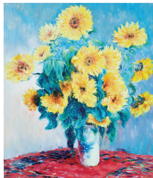
《向日葵》夏荣华(油画)