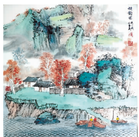
《秋韵图》章彪(中国画)