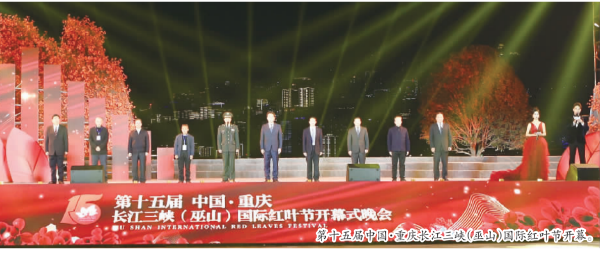
第十五届中国·重庆长江三峡(巫山)国际红叶节开幕。

2021年11月26日,第十五届中国·重庆长江三峡(巫山)国际红叶节开幕式晚会在巫山红叶广场举行。 从2007年开始,巫山便在全国率先打响“三峡红叶”旅游品牌,举办首届“中国重庆长江三峡国际红叶节”。在这一品牌的推动下,巫山接待游客由2007年的135万人次增至2020年的1957万人次。