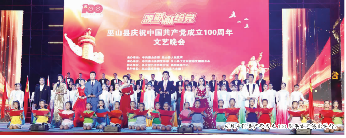
庆祝中国共产党成立100周年文艺演出举行。

“百年再起航,永远跟党走。”2021年6月29日,“颂歌献给党——巫山县庆祝中国共产党成立100周年文艺演出”在市政广场举行。 歌与舞、诗与乐、光与灯、辞与章……巫峡儿女以歌为史,以舞言志,以文艺演出的形式回顾了党的艰苦奋斗历程,讴歌了党的光辉业绩,表达了感党恩、听党话、跟党走的决心,展现了奋力书写新时代新篇章的信心。