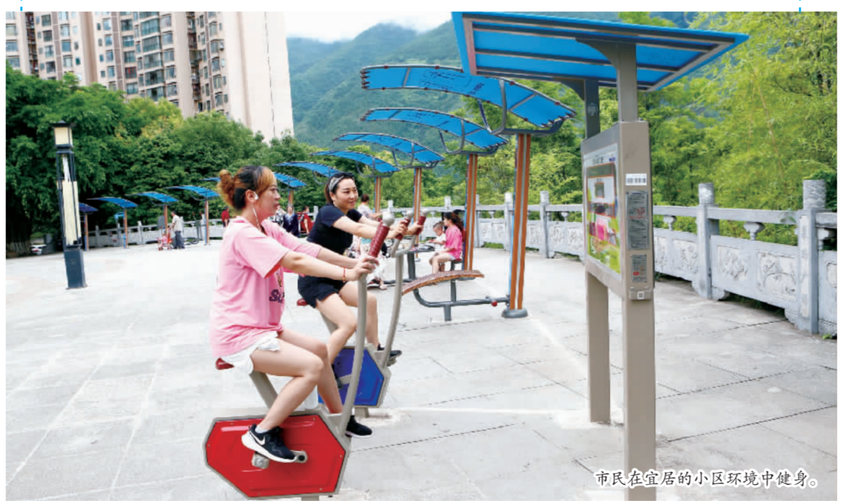
市民在宜居的小区环境中健身。

着力破解巫山发展难题、厚植巫山发展优势,实现生态美、产业兴、百姓富有机统一;用心用情用力解决好群众“急难愁盼”问题,以及影响市场主体健康发展的堵点、难点问题,让人民群众满意、市场主体满意、游客满意。