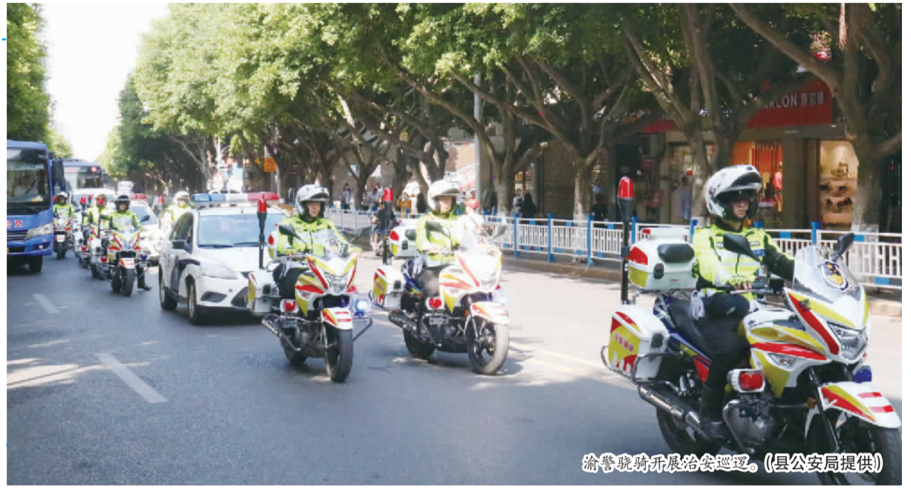
渝东交警开展给会治理。

2021年12月15日,平安中国建设表彰大会在北京隆重举行。巫山县获评“平安中国建设示范县”荣誉称号,县委书记曹邦兴参加表彰大会。 “平安中国建设示范县”每4年评比一届,反映的是一个城市的平安建设成果、社会治理水平。我县已连续获得2013至2016年度“全国平安建设先进县”、2017至2020年度“平安中国建设示范县”荣誉称号。