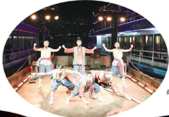
舞蹈《川江号子》。