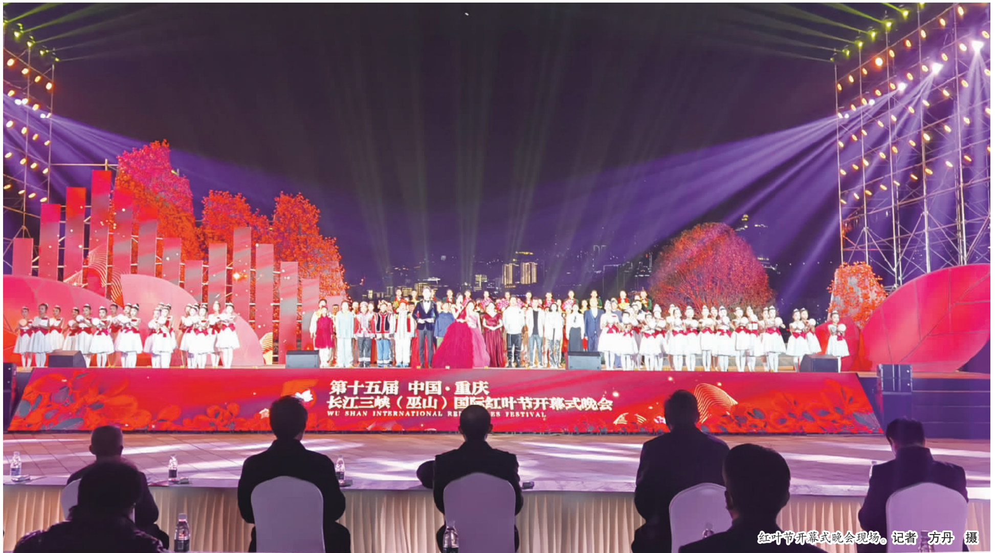
红叶节开幕式晚会现场。