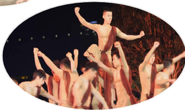
情景舞蹈《激流险滩》。