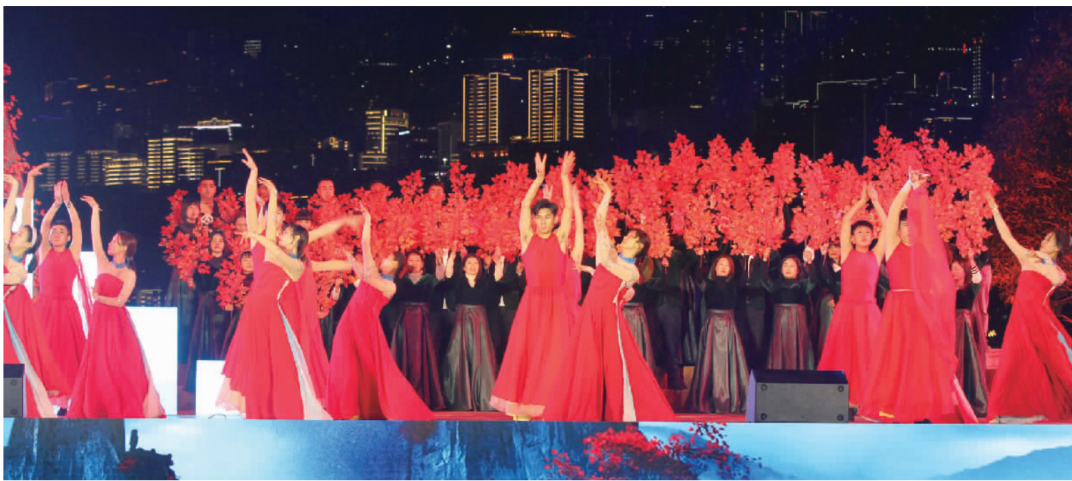
歌舞《满山红叶似彩霞》。