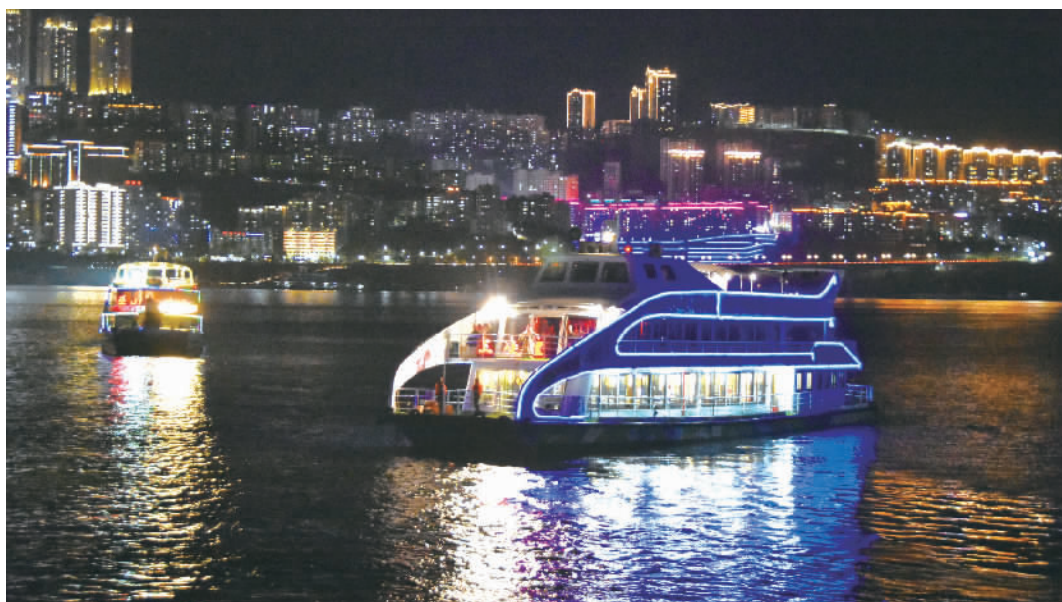
长江情景夜游。