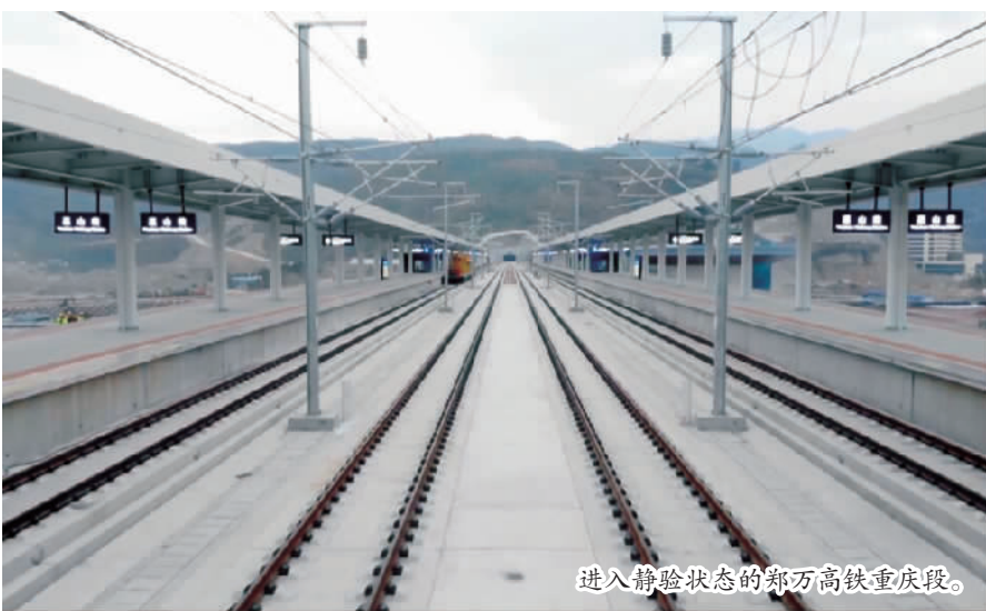
进入静验状态的郑万高铁重庆段。

本报讯 (记者 龚傲 文/图) 11月10日,随着由中铁二局承建的郑万高铁重庆段剩余工程收官,至此,郑万高铁重庆段正式进入静态验收阶段,为郑万高铁全线早日建成通车奠定了坚实的基础。