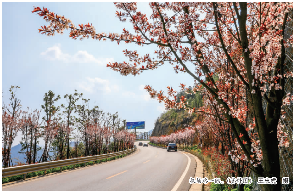
机场路一隅。(资料图)

本报记者 向君玲 今年1—10月,巫山机场累计安全保障运输飞机1128架次,游客吞吐量达7.2万余人次,货邮吞吐量7.158吨,分别与2020年同比增长51.21%、97.53%、155.92%。这意味着依托机场这一空中廊道,我县正进一步打通渝东北交通瓶颈,构建起内畅外联的综合交通网络。