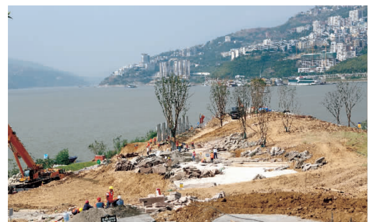
10月6日,工人们在宁江渡公园加班加点作业。