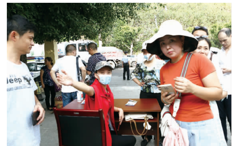
国庆期间,青年志愿者热情地为游客服务。