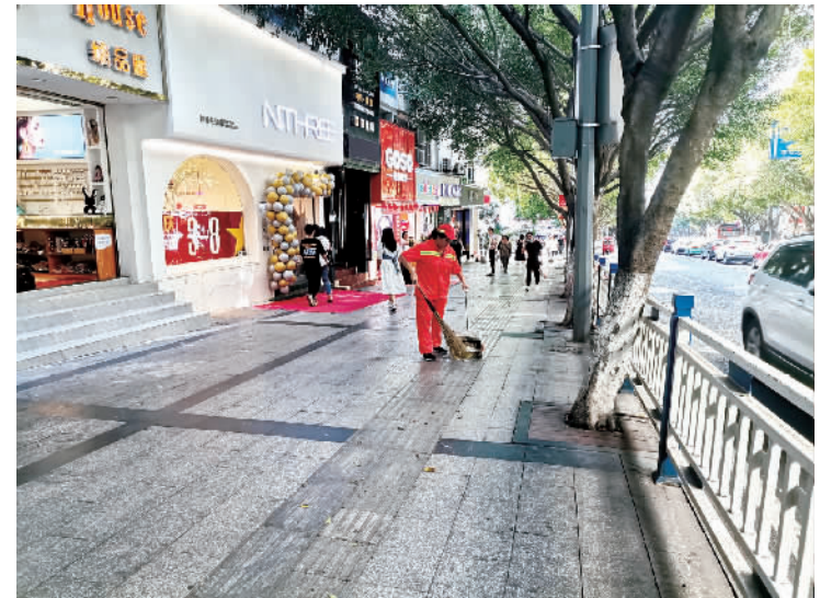
10月2日,环卫工人穿梭大街小巷,清扫街面垃圾。