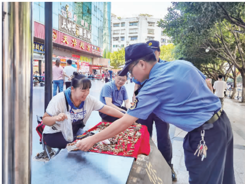
10月2日,城市管理综合行政执法支队工作人员维护公共秩序。