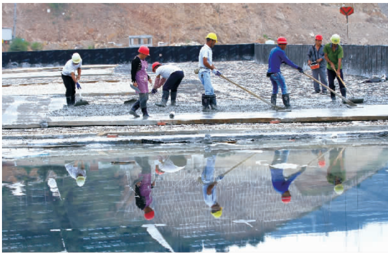
10月6日,郑万高铁巫山站站前广场上,工人们在浇灌混凝土。