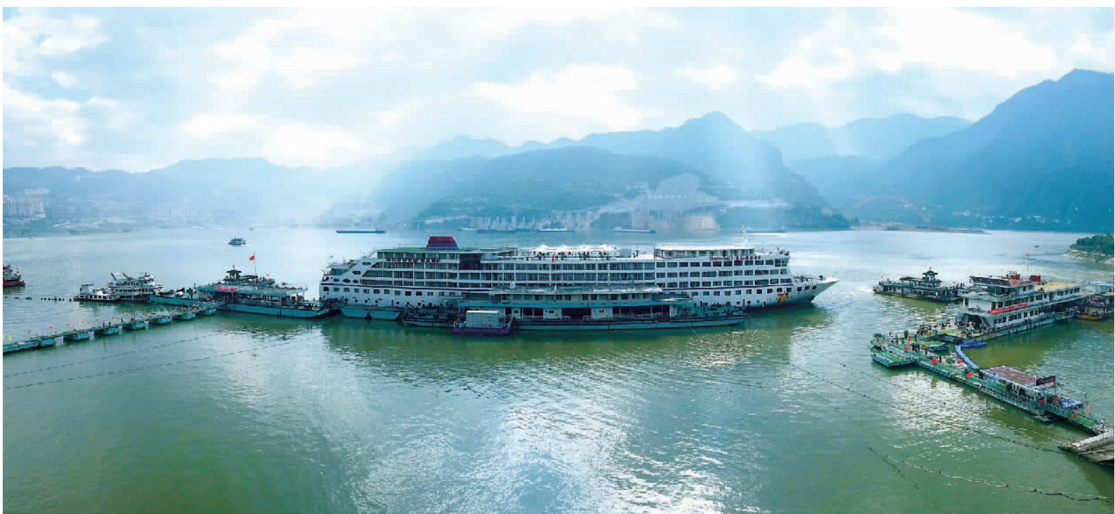
游客在疫情防控安全下分区分批登船。