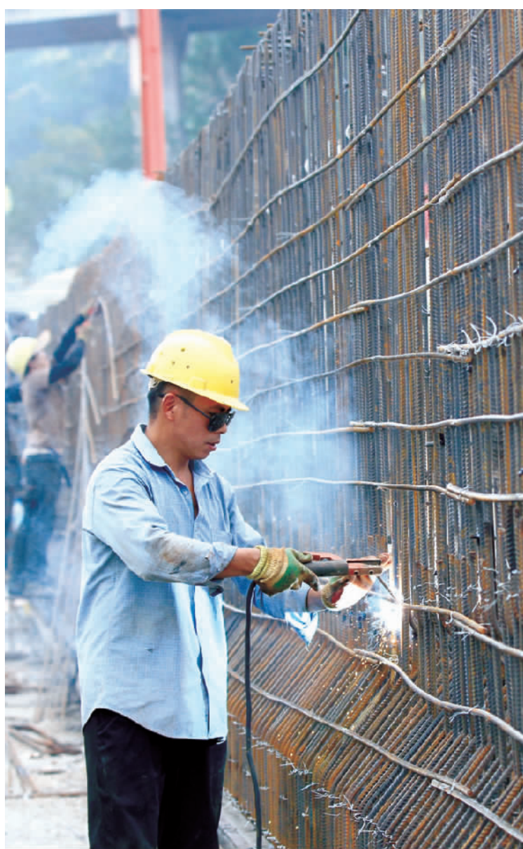
10月6日,工人们在白子溪大桥上作业。