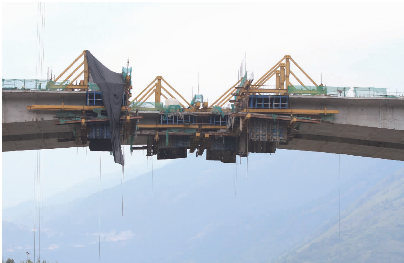
国庆期间,建设者们一直坚持在重点工程建设现场。