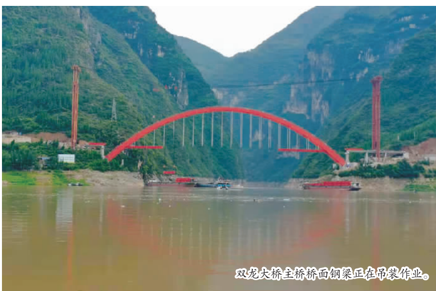
双龙大桥主桥桥面钢梁正在吊装作业。

本报讯 (记者 王忠虎 通讯员 李琳婕文/图) 9月2日,记者从由北新路桥集团承建的巫山双龙大桥项目部获悉,截至当日,该桥主桥桥面钢梁已完成第8节段的吊装作业,整个吊装工作有序推进。