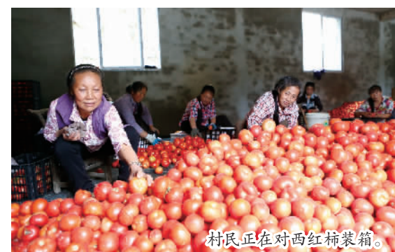
村民正在对西红柿装箱。

本报讯 (记者 卢先庆文/图) 9月3日,在竹贤乡石院村,村民正分拣西红柿,准备销往市场。