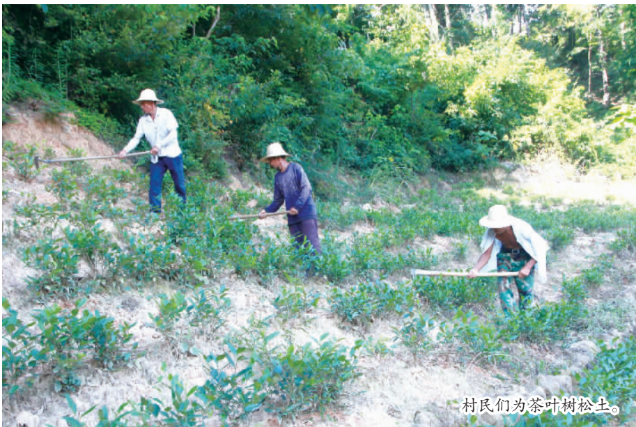
村民们为茶叶树松土。