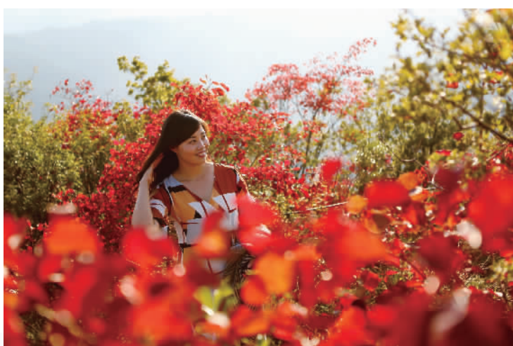
游客在巫山红叶中留影。