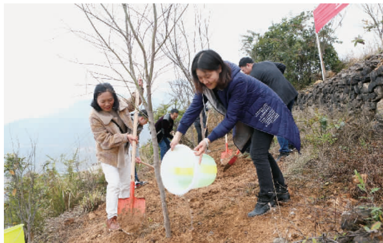
志愿者植树。