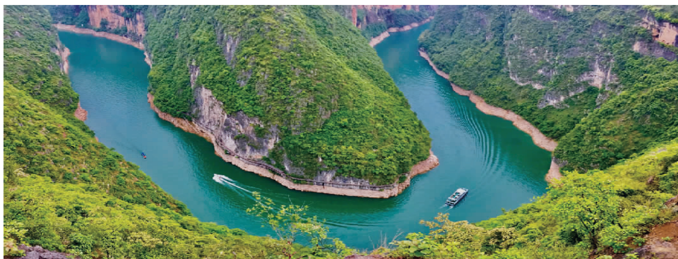
巫山小三峡鱼头湾景观。