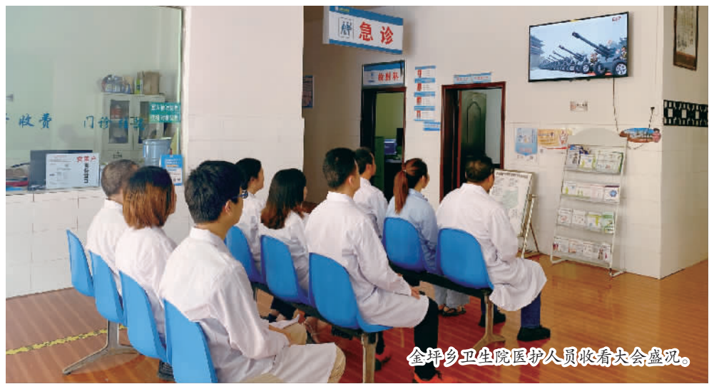
金坪卫生院医护人员收看大会盛况。

本报讯（记者 曾露 文 / 图）7月1日，县卫生健康系统组织系统干部职工收看庆祝中国共产党成立100周年大会直播。 100响礼炮，国旗护卫队的三个100步，庄严的升旗仪式……这是一个充满庄严感和自豪感的伟大历史时刻，这是一场厚重、温暖、昂扬、充满青春的盛典。 习近平总书记的重要讲话在广大卫生人心中激荡起万千波澜。观看结束后，党员干部纷纷表示，感到骄傲和自豪，今后在平凡的工作岗位上要做出不平凡的业绩，要坚定理想信念，肩负起新时代的历史使命和责任，不负韶华，不负人民，在卫生事业战线上做出应有的贡献。