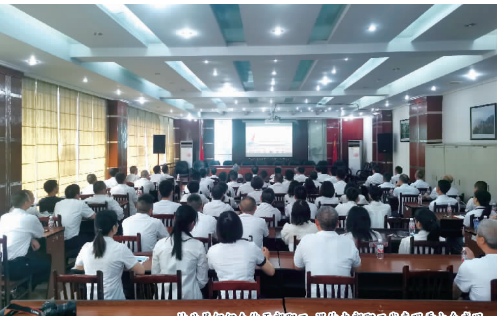
林业局组织全体干部职工、退休支部职工代表观看大会盛况。

本报讯（记者 董存春 文 / 图）7月1日，县林业局组织全体干部职工、退休支部职工代表共80余人，集中收看庆祝中国共产党成立100周年大会直播。 习近平总书记的重要讲话令大家心潮澎湃、震撼人心、倍受鼓舞。在收听收看习近平总书记庆祝中国共产党成立100周年大会后纷纷表示，在今后的工作中，以高标准、严要求的态度履职尽责、服务人民。以林长制工作为抓手，促进林业产业经济发展，加快推进“两岸青山·千里林带”等重点项目建设工作，不断优化营商环境，规范行政审批工作，为推动林业事业高质量发展贡献力量。 “作为一名退休职工，倍感中国共产党对我们的关照，我会永远记住党恩、跟党走、听党话。”一位老同志感慨道。