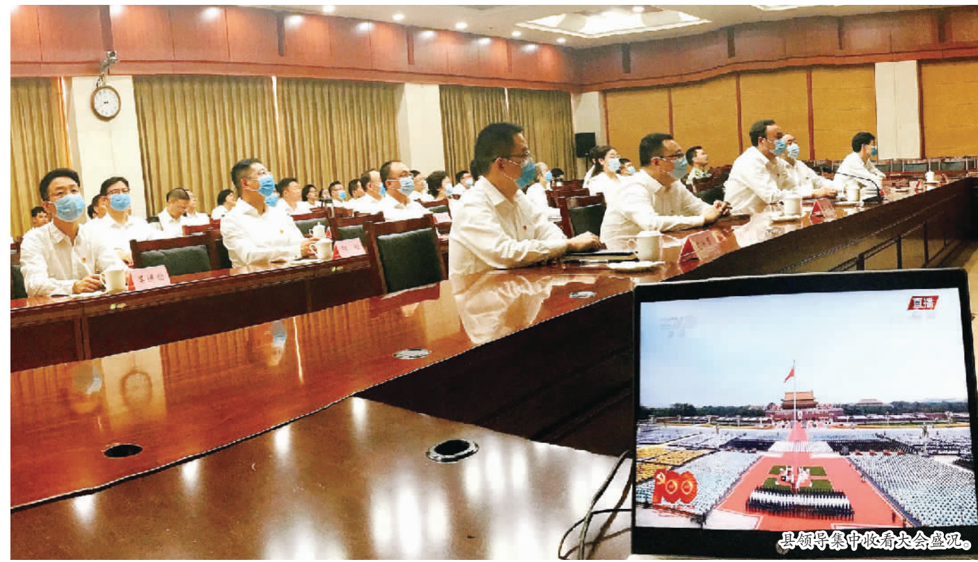
本报讯（记者 卢先庆 龚傲文 / 图）7月1日，县委理论学习中心组2021年第10次集中学习暨党史学习教育第5次专题学习会召开，集中收看庆祝中国共产党成立100周年大会直播。