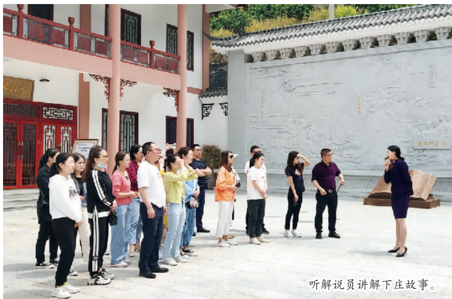
听解说员讲解下庄故事。

本报讯 (记者 陈廷权 何帮成/图) 走绝壁天路,悟下庄精神。5月12日,巫山云鸿医院党支部把支部主题党日活动和纪念“5·12”国际护士节活动结合起来,组织党员及其他医护人员到竹贤乡下庄村开展主题为“学史明理葆初心,护佑健康担使命”的纪念“5·12”国际护士节活动。