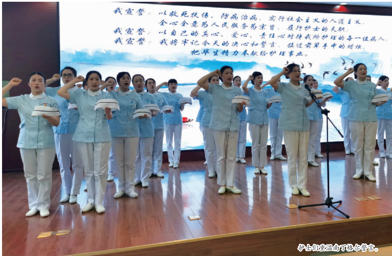
护士们重温南丁格尔誓言。

本报讯 (记者 曾露文/图) 自5月10日起,县卫生健康系统开展以“学史明理葆初心 护佑健康担使命”为主题的“5·12”国际护士节庆祝活动,共评选出“30年护龄工作者”5名、“优秀护士长”10名、“优秀护理工作”34名,并通报表扬。