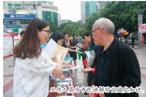
工作人员为市民讲解防灾减灾知识。

本报讯 (记者 向海燕 陈兵文/图) 今年5月12日是我国第13个全国防灾减灾日。当日,多部门联合在市政广场组织开展2021年“5·12”防灾减灾日宣传活动。