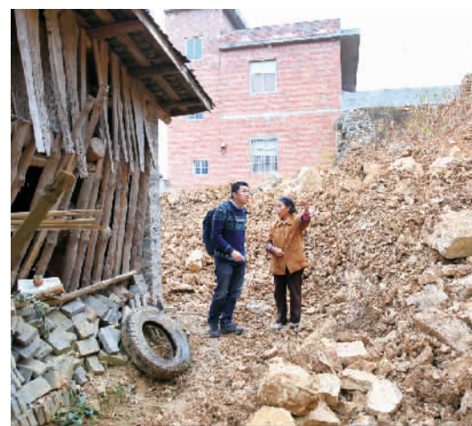
2021年4月8日,县里为打造小三峡陆上旅游环线,在原有步道的基础上进行了提档升级,并建设了观景平台、厕所、接待中心等配套设施。